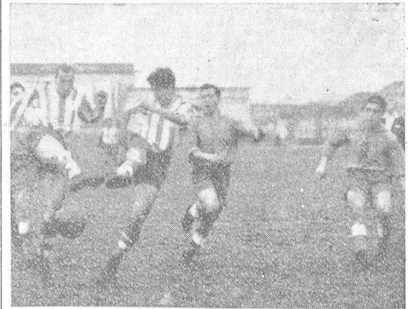
El entusiasmo de los deportivistas queda de relieve en este momento que capta el objetivo de Blanco, y en el marcar, se estorban mutuamente por aumentar el tanteo

(CONTINUACION DE TERCERA) laga fue acertadamente anulado por Otero.