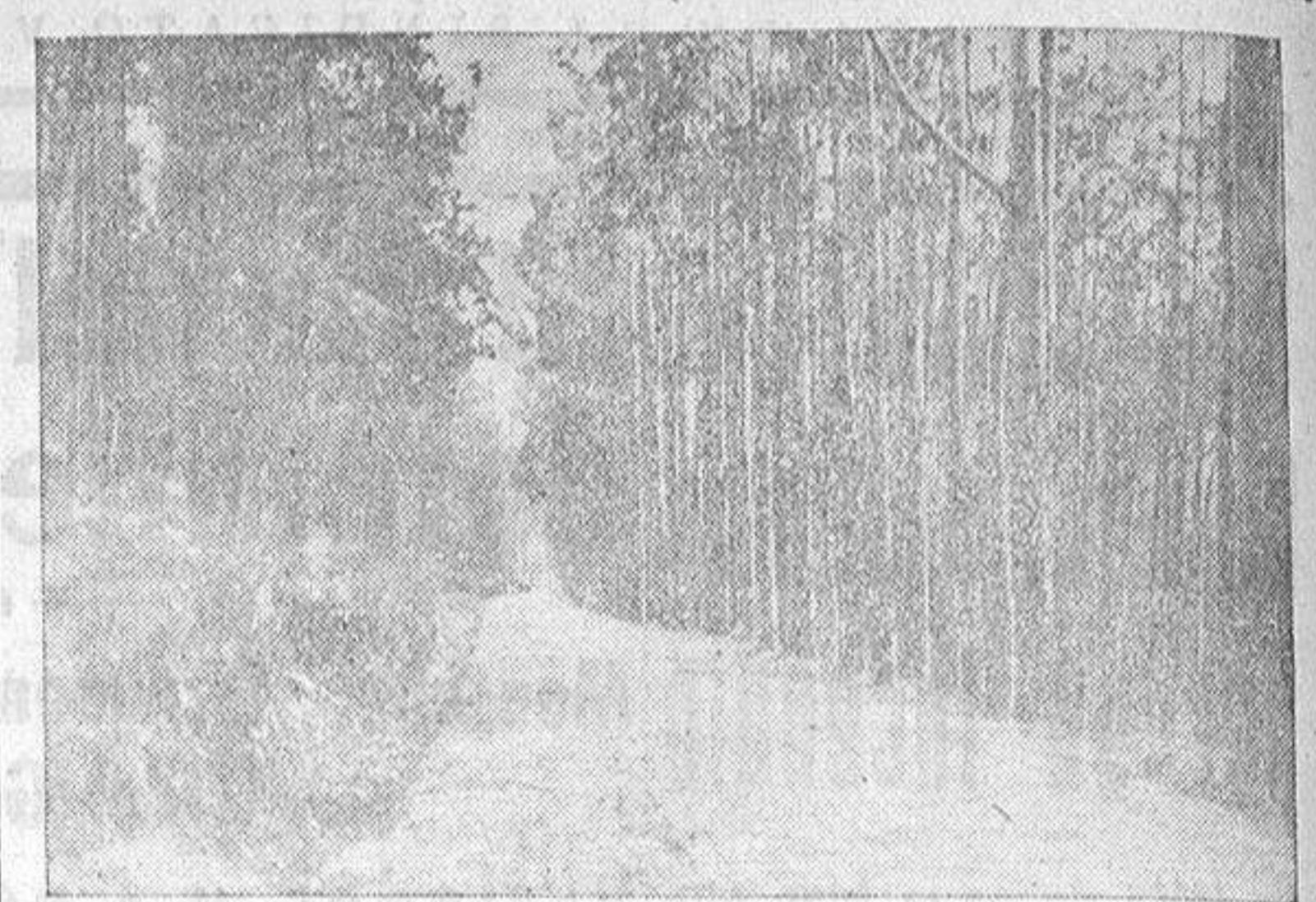
Carretera forestal en la ladera del monte Xaxan, en Pontevedra, hoy totalmente repoblado.

Los Ayuntamientos tenían totalmente abandonada la tutela administrativa de los montes comunales, sobre los cuales cayó la lluvia benéfica de la repoblación, convirtiéndolos, de eriales, en emporios de riqueza. La repoblación de la península de Morrazo comprende cuatro ayuntamientos y de ella salen ya hoy apenas para las minas de Asturias; este año en número de 90.000. No basta esto, porque entre aprovechar el árbol en rollo, y aprovechar la madera industrialmente, media un abismo de dinero. Por eso el Patrimonio forestal, desde 1934 se puso en relación con el