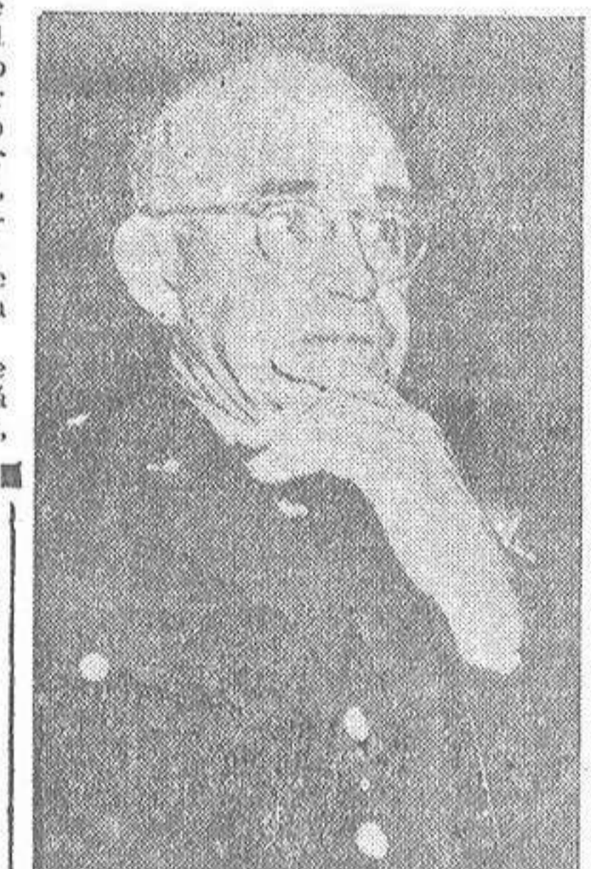
GENERAL OMAR BRADLEY

En hacer el mapa en cuestión se han invertido nueve meses. Dirigirá el ejército el mariscal Montgomery,