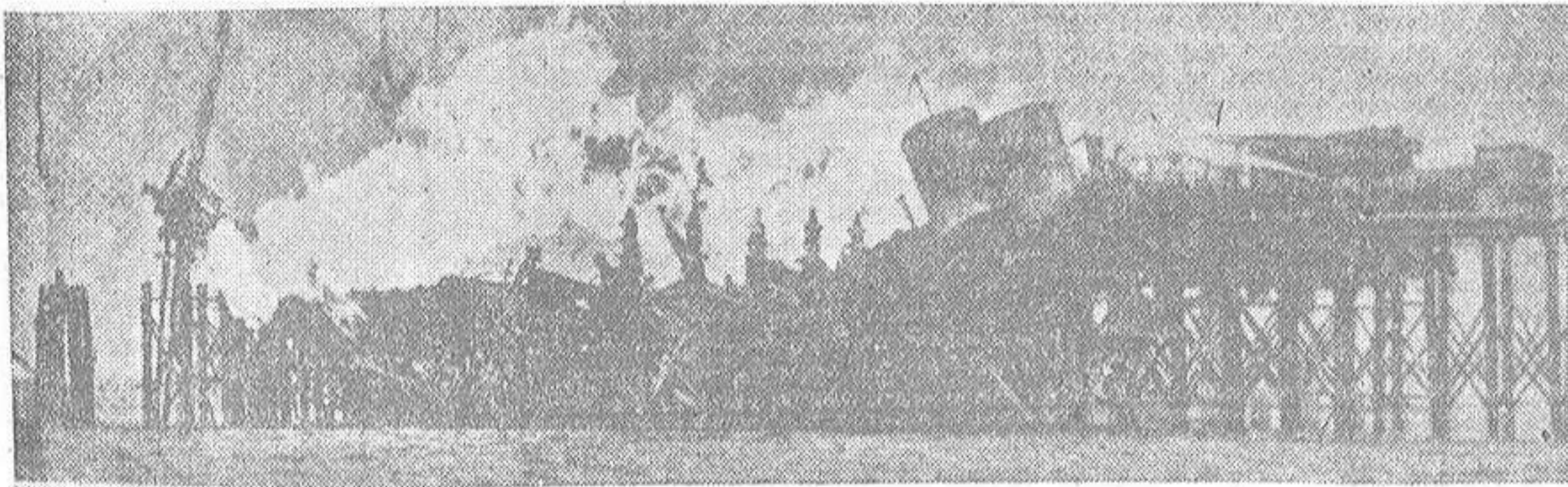
Un pozo submarino de petróleo en la costa de Luisiana (Estados Unidos) incendiado hace unas semanas, que fué apagado en pocos días por el hombre que mejor sabe luchar contra las llamas y la enorme temperatura que rodea esta clase de incendios

Tiene una pierna inútil, el vientre quemado y multitud de cicatrices