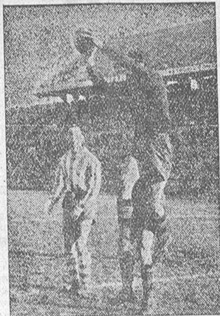
El portero internacional detiene con seguridad un balón por alto.

Con el conjunto completo o con suplentes, en tardes aciagas tanto como en días afortunados, en períodos de decadencia igual que en épocas de brillantez, el Barcelona se nos ofrece siempre como gran equipo. Queda dicho que ayer mandó en el Estadio. Sólo falló en la dirección de tiro, y aun así realizó disparos certeros en mayor cantidad que su contrario. Sus líneas funcionaron sin fallos ostensibles, cumpliendo, sospechamos