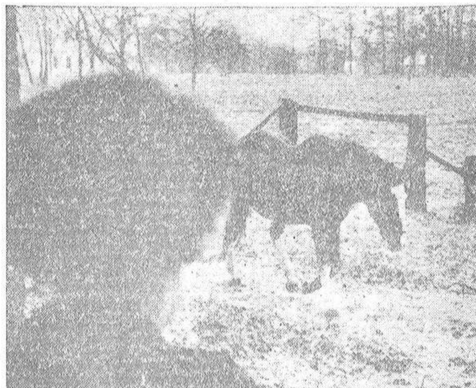
"Lady Wonder" lleva con dignidad sus veintisiete años de edad y, sobriamente, con aire de suficiencia, se dirige desde el prado donde tomaba un "lenteplé" a la cuadra, donde tiene su "gabinete de trabajar". Ha sido requerida para que conteste a graves preguntas y no quiere hacerse esperar. Y luego dicen que no hace un tanto cada día...