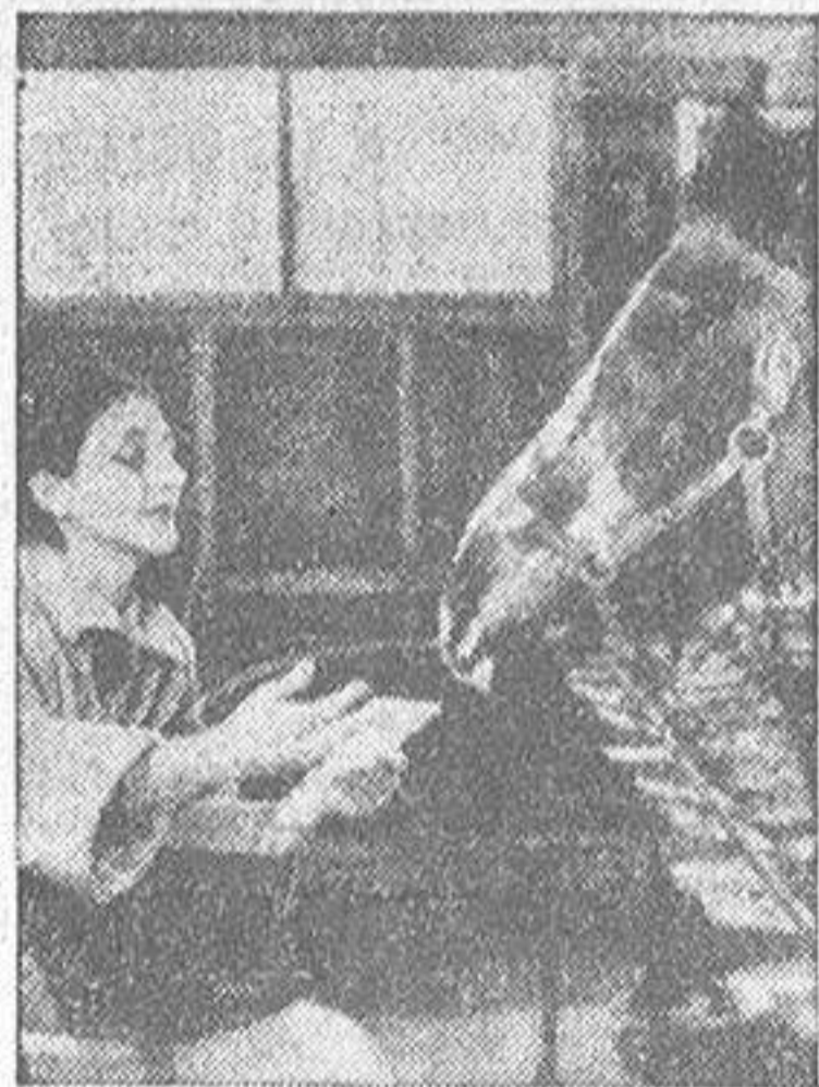
Atí tienen ustedes a "Lady Wonder" contestando a las preguntas que se le hacen. Y ahí tienen ustedes al oráculo de turno preguntando. Esta vez se trata de una mujer. No se fía de los hombres, y prefiere preguntar a un caballo...

Una de estas mañanas salimos a la calle el fotógrafo y yo sin otra misión definida que la de captar el ambiente. Así, este reportaje no tiene cifras ni plantea problemas, ni los resuelve. Es (CONTINUA EN SEPTIMA PLANA)