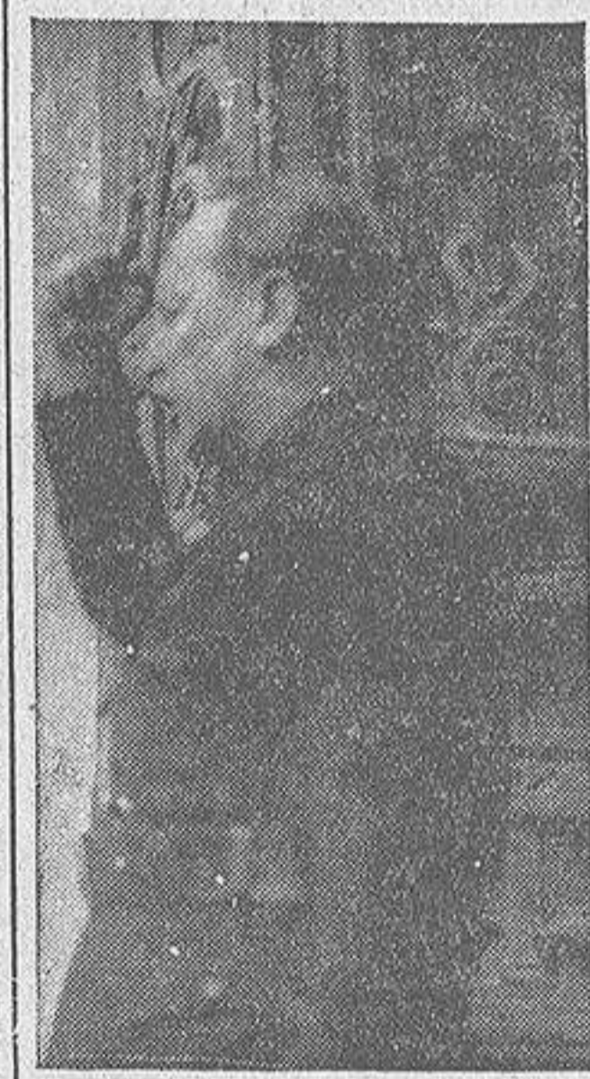
El Excmo. Sr. D. Raimundo Fernández Cuesta

Fernández Cuesta exhorta a proseguir con entusiasmo la labor emprendida