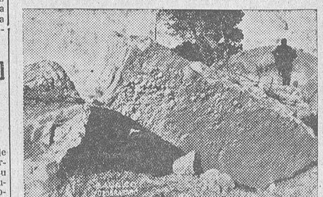
Gigantesca mole granítica removida por los disparos de nuestra artillería de grueso calibre en uno de los frentes de guerra

Por la tarde se celebró en el hotel "Fernando e Isabel" una comida a la que asistieron los ministros y jefes del Movimiento.