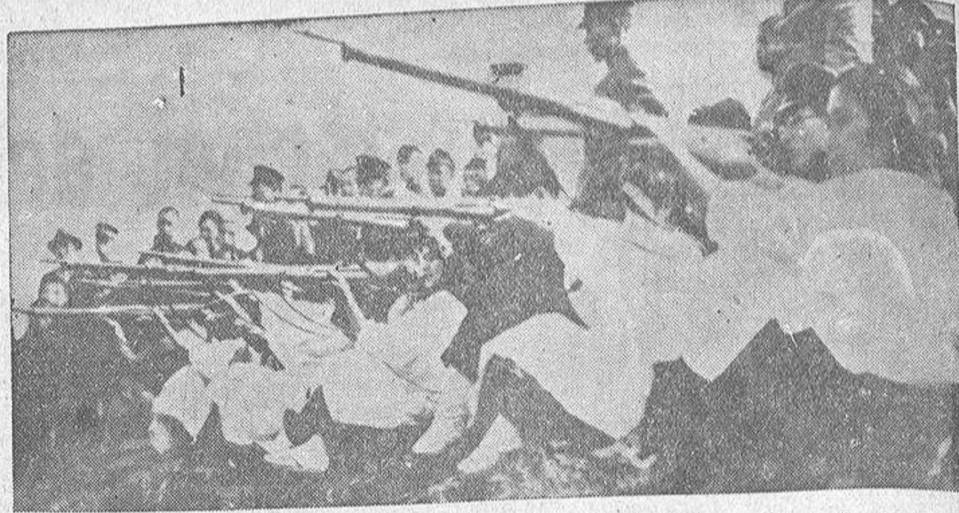
Miembros de la Asociación Femenina de Defensa Nacional, de Osaka (Japón), entrenándose en el manejo del rifle, bajo las órdenes de oficiales del ejército nipón

Seguidamente desfilaron las tropas con toda brillantez entre las aclamaciones del numeroso público que presenció el acto.