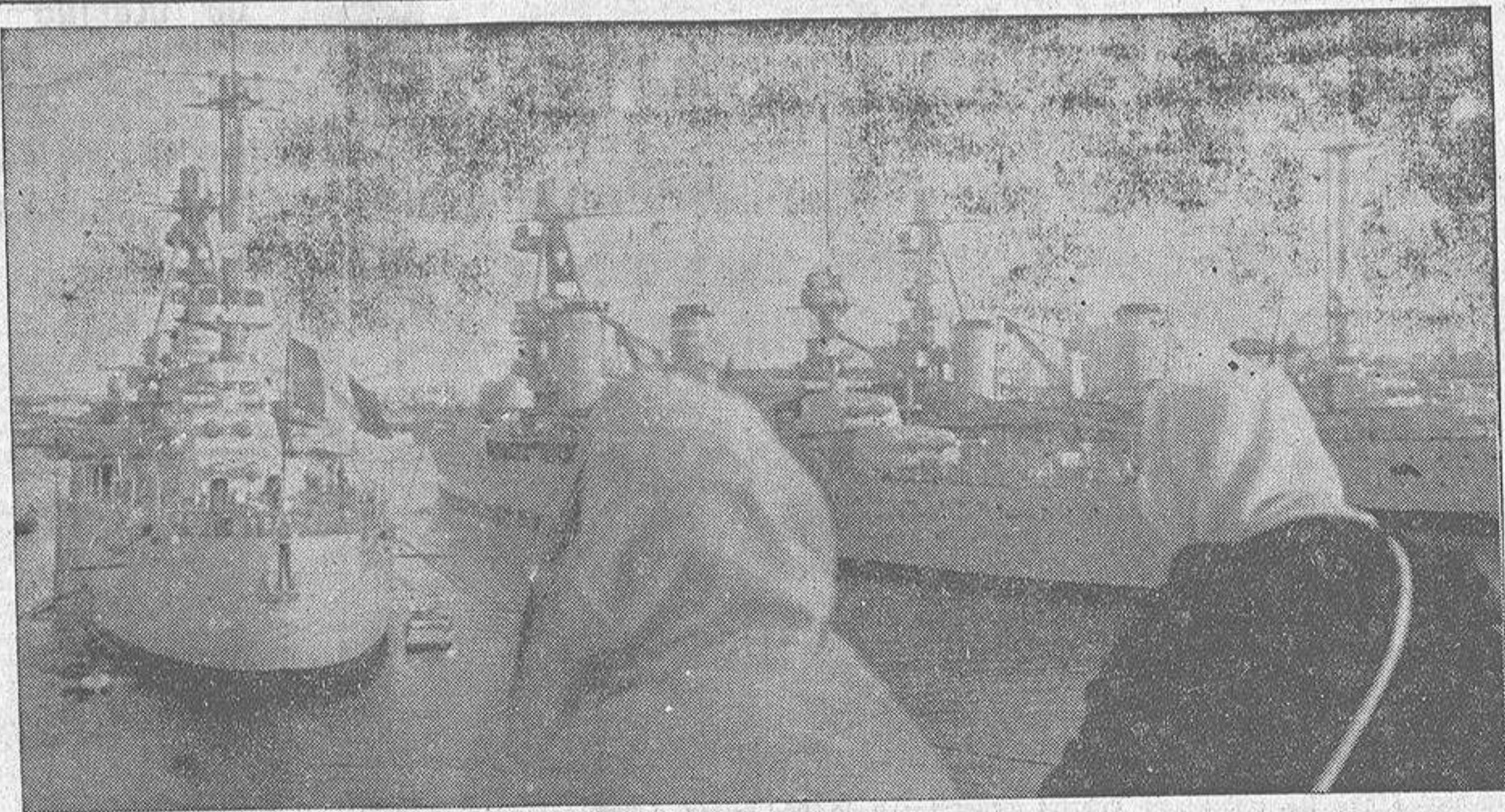
Los buques de guerra franceses, pertenecientes a la Esquadra del Mediterráneo, visitando los puertos marroquíes sometidos al protectorado de Francia, en cuyos puertos la situación social no es nada tranquilizadora debido a los manejos y propagandas de los agitadores frente-populistas y soviéticos