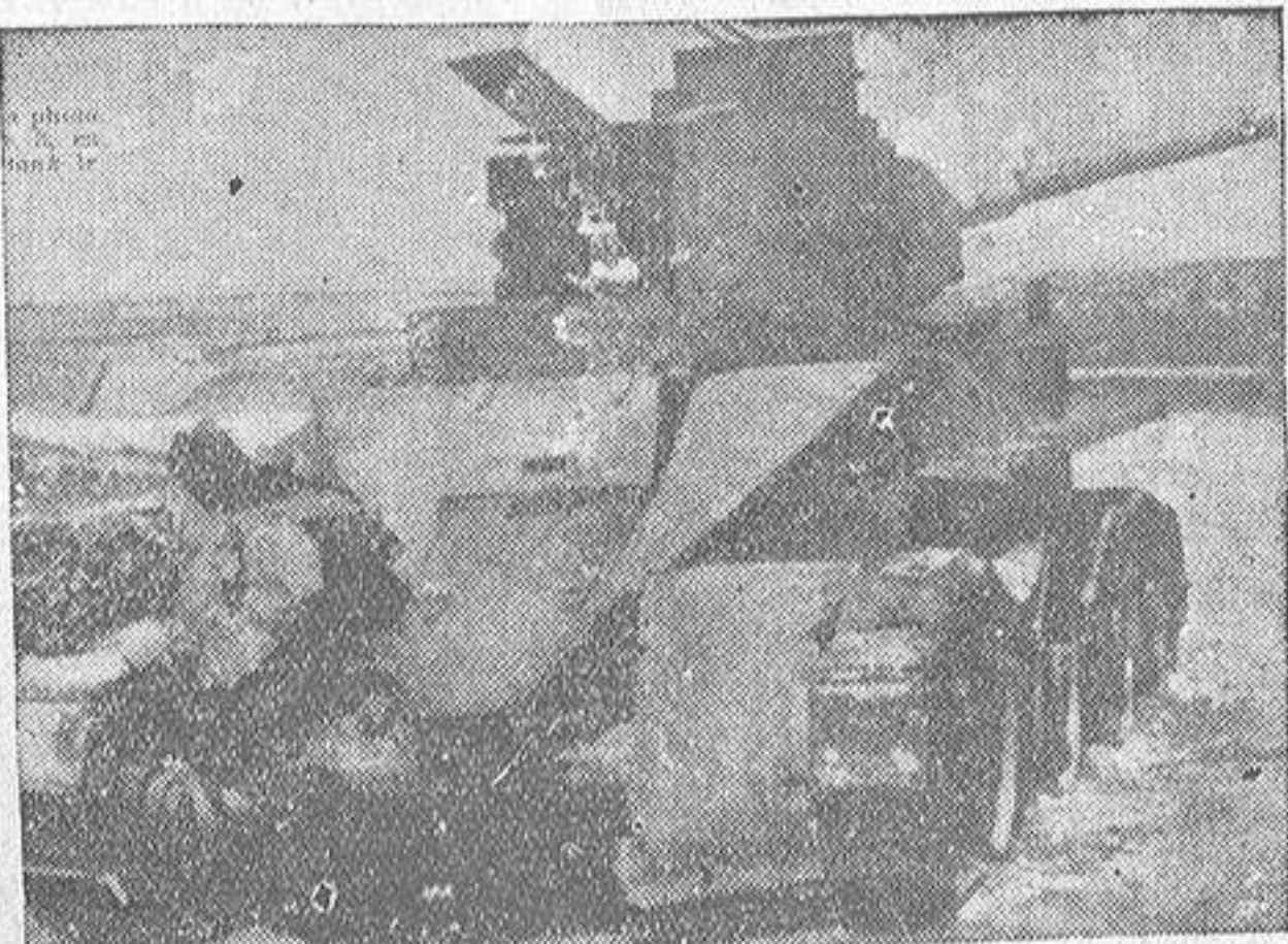
Otra prueba fehaciente de la no intervención: tanque ruso capturado por nuestros bravos soldados en el frente de Levante

Sentimos necesidad de volver a glosar aquel magnífico discurso del gran Calvo Sotelo en el famoso mitin de San Sebastián, por su grandeza, por su extensión y por sus alcances. Pero es que Vasconia — decía nuestro inolvidable paisano — está unida a la Historia de España, no como rama frondosa de su tronco, sino como parte alicuota de ese mismo tronco, con una participación gloriosa y glorificable de España. Esto no lo comprendían de buena fe muchos vascongados. Lo alcanzaban, sí, otros, sobre los que recae la responsabilidad de lo sucedido. Vasconia fué siempre de España, no solamente en el orden material, geográfico e histórico. Vasconia estaba y está unida espiritualmente a España en todos los momentos transcendentales de su vida. Por eso ayer se festejó la conquista de Bilbao en España. La gloria y alegría por restituir a España un pedazo de su suelo, cuna de tanto héroe y de tanto santo, es y fué ayer el objetivo del aniversario glorioso.