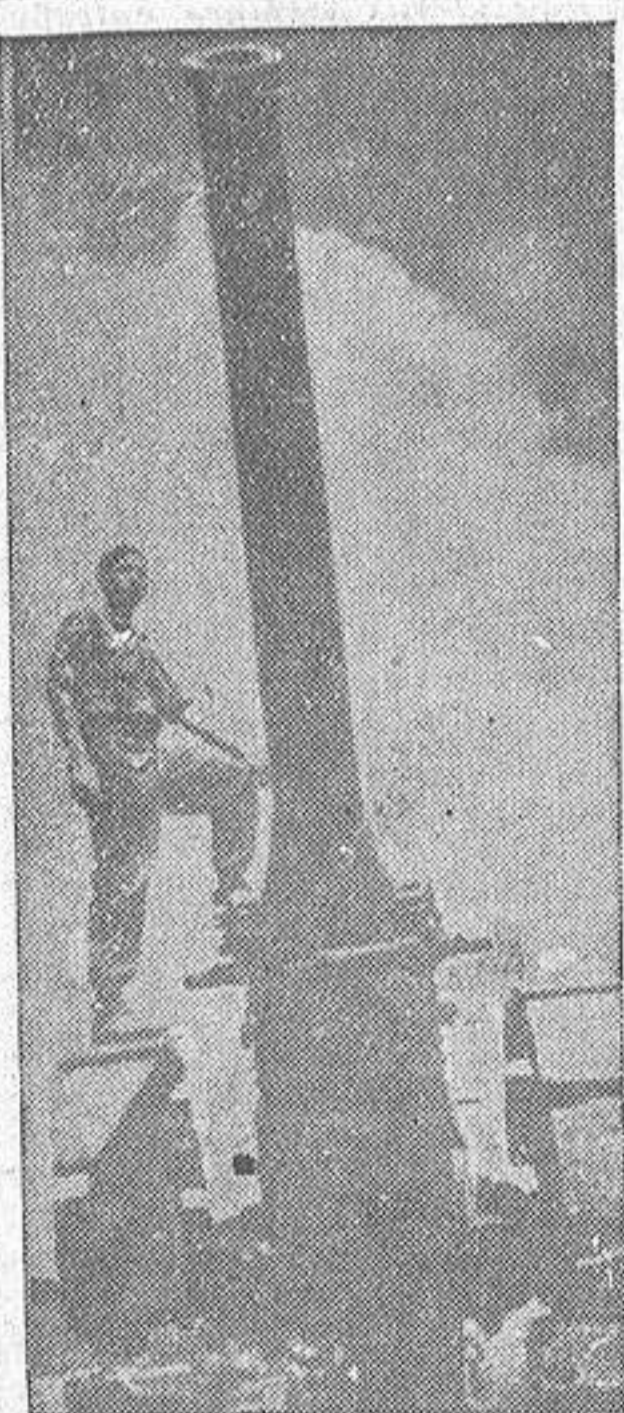
Cañón francés de grueso calibre vendido a los rusos, enviado por éstos a los rojos españoles y cogido por los soldados de Franco en el sector de Corbalán

El día 15 se bombardeó eficazmente el puerto de Barcelona. En la noche del 15 al 16 fué atacado tres veces el tráfico de la carretera y también el ferrocarril de Burriana a Sagunto, con las estaciones de Chilches y Nules. El 16 fueron bombardeados la central eléctrica de San Adrián, el puerto de Valencia en el que se alcanzaron los muelles interiores; el puerto de Barcelona, alcanzando la Dársena del Comercio, almacenes y buques; otra vez el puerto de Valencia, donde se alcanzaron depósitos en los que se provocaron incendios y explosiones, y el puerto de Tarragona. El 17 se bombardearon el puerto de Cartagena y el aeropuerto de San Vicente, y los puertos de Barcelona y Valencia, y en la noche de este día el tránsito de la carretera al sur de Burriana y estaciones de Chilches y Mascarell, y la fábrica de Burriana. En el día de hoy, en combate aéreo en la región al Sur de Teruel, se han derribado ocho aviones enemigos, de ellos seis tipo "Curtis" y dos "Boeing", sin pérdida alguna por nuestra parte. Otro avión rojo tipo "Martin Bomber" ha sido abatido por nuestras baterías antiaéreas. Salamanca, 19 de junio de 1938. — Segundo Año Triunfal. De orden de S. E., el General Jefe de Estado Mayor, Francisco Martín Moreno.