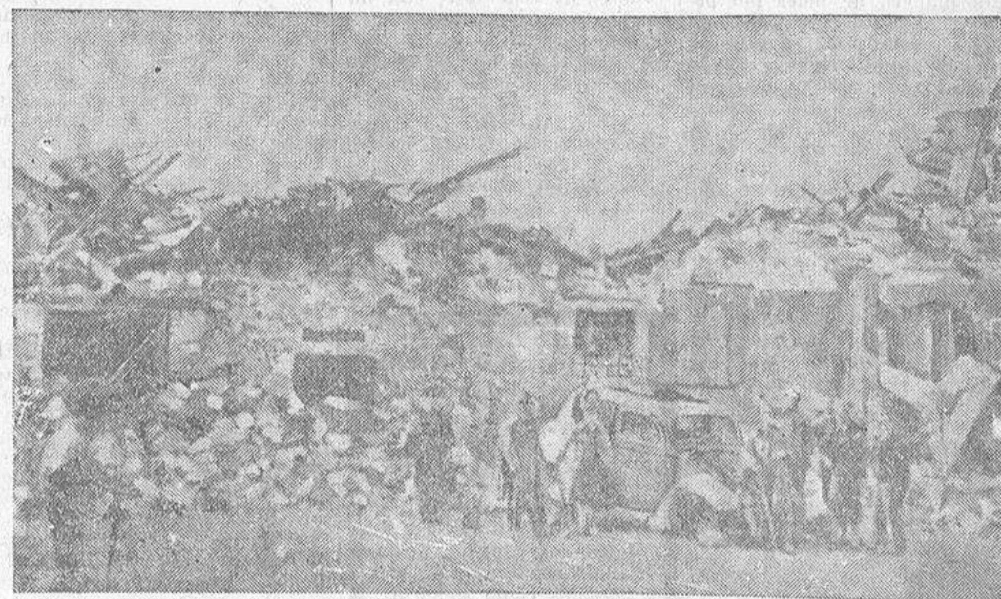
Aspecto que presentaba Trijueque, en el frente de Guadalajara, cuando las gloriosas tropas nacionales lo conquistaron. Los marxistas, antes de abandonar el pueblo, se entregaron al crimen, al robo y a la destrucción. Por Trijueque también había pasado la barbarie roja