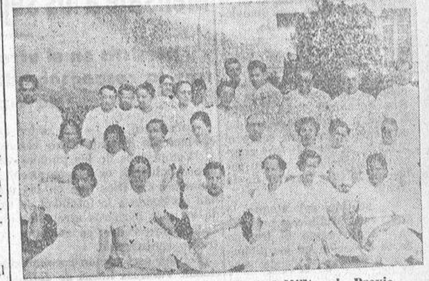
Médicos y enfermeras del Hospital Militar de Pravia

Había sido antes cuartel general de las hordas rojas