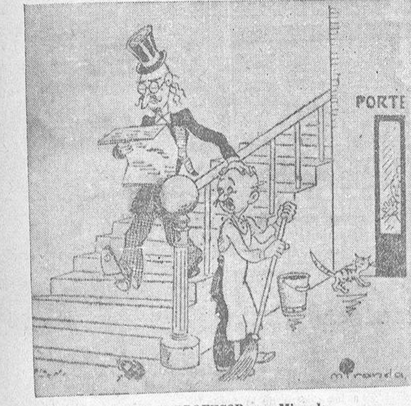
SABIO PROFESOR, por Miranda

Francia e Inglaterra, con el asentimiento de los E. U., han encomendado a este Jefe de Gobierno, que es una reconocida autoridad en cuestiones financieras, un estudio sobre las posibilidades de reducir los obstáculos que hoy entorpecen el comercio internacional. Será ello base para una Conferencia Económica a la que pudieran concurrir todos los Estados que han marcado su divorcio de la S. D. N. Y ya se sabe que en los asuntos de economía van envueltos todos los más fundamentales problemas pendientes: primeras materias, colonias, migraciones, empréstitos, etc. Aunque, al parecer, sin gran entusiasmo, la prensa alemana se interesa en la iniciativa.