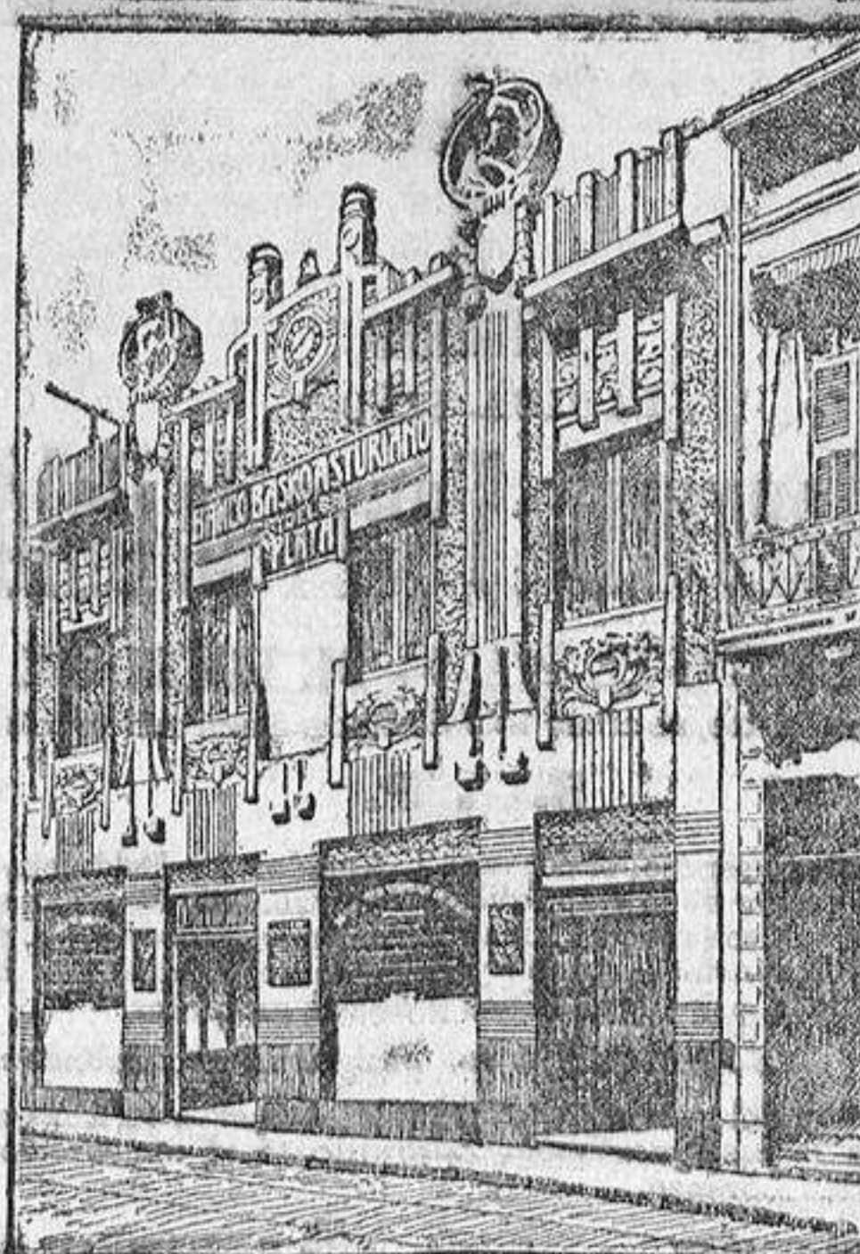
EDIFICIO DEL BANCÓ

Buenos Aires.—Calle Maipú, 73 al 87. Casilla de Correos, 619