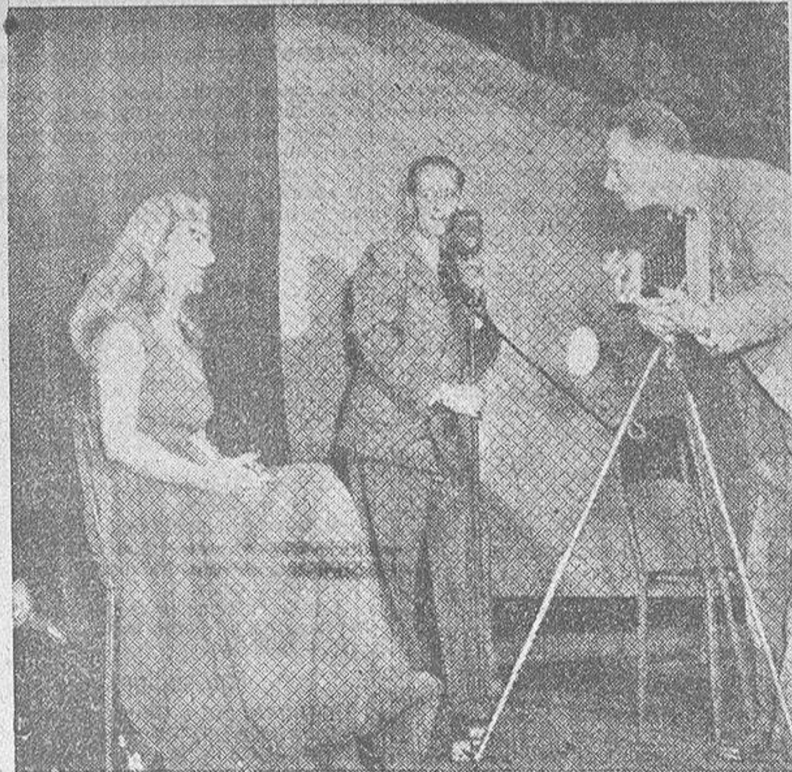
Ya está todo dispuesto para la foto. Sonríe... ¡Gracias!

Dos rollos y una cápsula de productos químicos hacen todo el trabajo