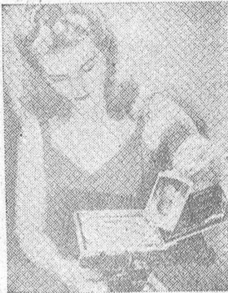
Un minuto después, la prueba terminada, está en sus manos

La General Electric ha fabricado ya un fotómetro especial para esta clase de cámaras, a fin de que la precisión de la foto sea absoluta. Se enfoca y dispara como una máquina portátil cualquiera. Una vez obtenida la fotografía, oprime usted un botón y sale por un extremo una tira de papel que extrae usted. No hay más que espe-