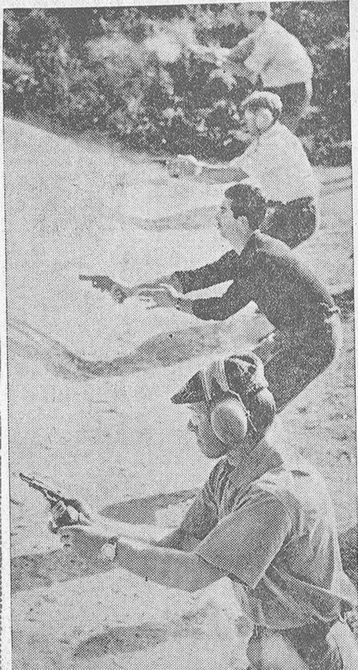
Los guardaespaldas de Georges Pompidou, Presidente de la República Francesa, han abierto una escuela donde reciben enseñanzas no sólo los policías franceses, sino también agentes de diversos países. El aprendizaje, a su vez, lo recibieron en los Estados Unidos, donde quince de ellos—eran entonces los tiempos de la presidencia de Charles De Gaulle—acudieron a los Estados Unidos para aprender los métodos de la F. B. I. Si en torno a Charles De Gaulle—después del atentado de que fue objeto por parte de la O. A. S.—sus "gorilas" permanecían en vigilancia las veinticuatro horas del día, la atmósfera parece haberse hecho más respirable alrededor del nuevo Presidente. Así es como sus guardaespaldas pueden permitirse el lujo de impartir enseñanzas a otros agentes. Dar cinco balas en el blanco a una distancia de quince metros, servirse de las armas al igual que de las piernas, son algunos de los ejercicios que efectúan diariamente y de los que aquí ofrecemos un aspecto gráfico.