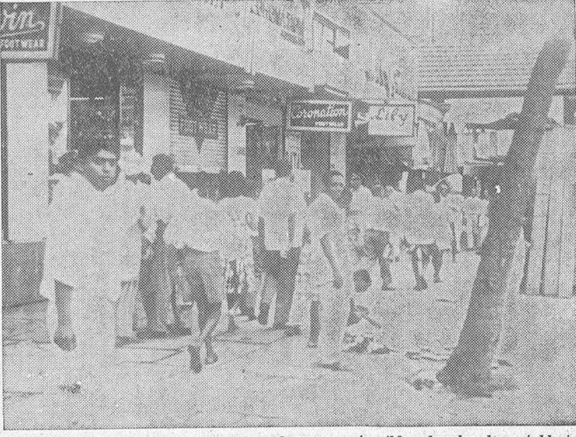
En las calles de Bombay, donde la pobreza es ostensible, abundan los establecimientos dedicados al comercio del oro, cuyas partidas entran con frecuencia de contrabando.