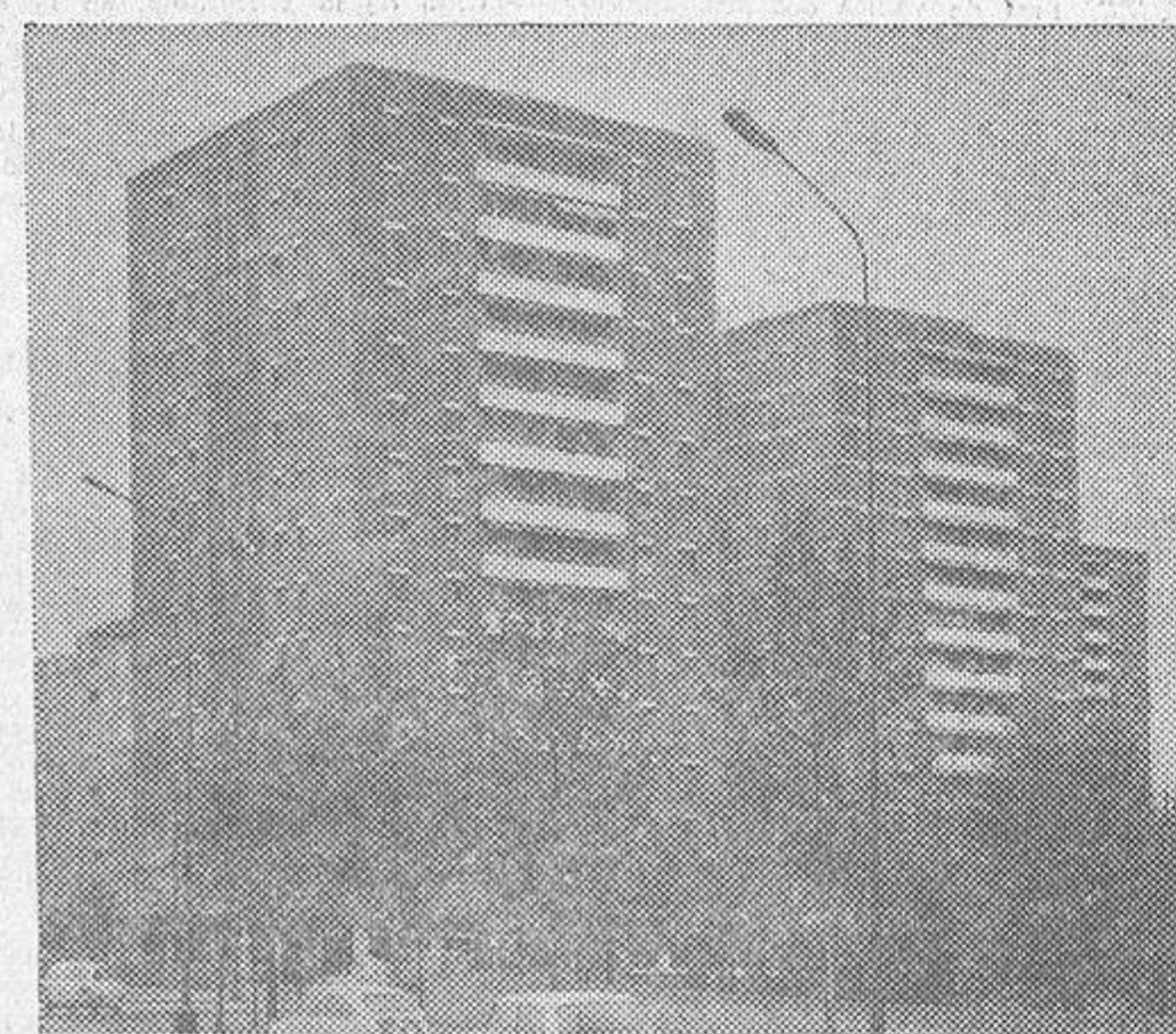
Torres del Barrio Moratalaz - Madrid

Es en esta rapidez de montaje y en sus consecuencias económicas en lo que debe fijar su atención cara a la construcción de su próximo edificio; pues, no debe olvidar, que la repercusión de cualquier tipo de estructura sobre el valor del metro cuadrado edificado no llega a suponer un 10%, y aun cuando en algunos casos pueda resultar algo más cara la estructura de acero, el coste final del edificio resulta inferior por la rapidez de construcción y consiguiente reducción de los gastos financieros.