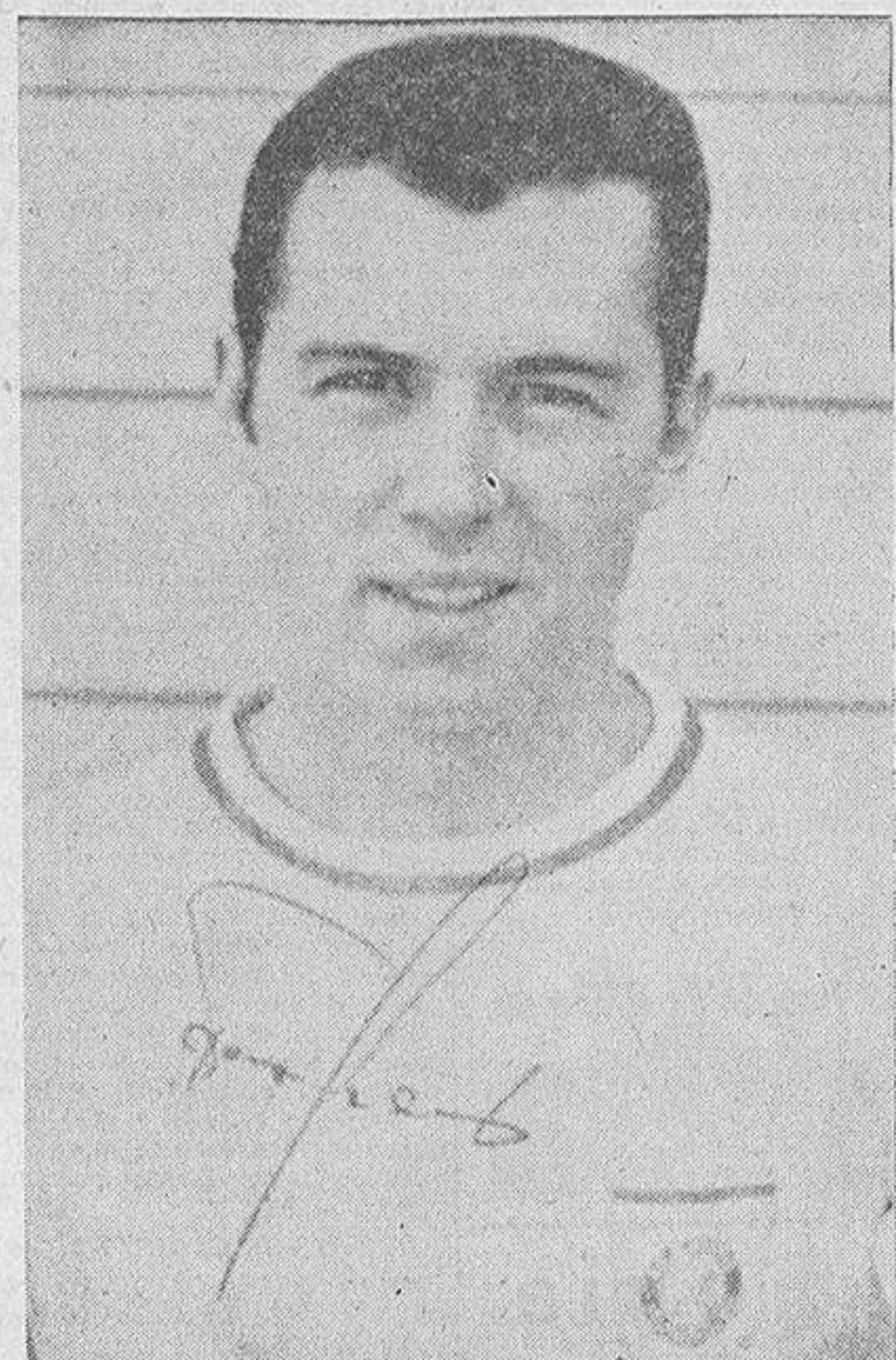
Beckenbauer, el gran jugador alemán, figura indiscutible de la selección de su país

Cinco minutos antes de que finalizara el encuentro los hinchas del equipo alemán invadieron el campo y el árbitro hubo de apagar el encuentro algunos minutos hasta que la policía despejara el terreno de juego. Terminado el encuentro el capitán del conjunto alemán, Beckenbauer, recogió la copa de campeón de Europa entre las aclamaciones de sus compañeros y seguidores.