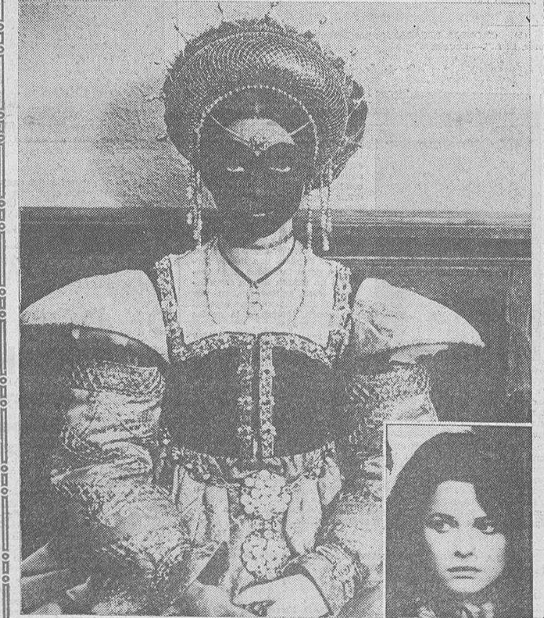
En la foto, la actriz inglesa Charlotte Rampling —a la que también vemos en el recuadro— tal como aparece en la película "Enrique VIII y sus seis esposas", que está rodándose en los estudios londinenses de Elstree. En el filme, Charlotte interpreta el papel de Anna Bolena, con cuya máscara aparece aquí poco antes de disponerse a danzar ante el soberano al que había de prender de sus encantos. La Rampling, nacida en Cambridge hace veintiseis años, ha sido primera figura ya en varias películas, algunas realizadas en Italia.

LONDRES, 18.—Un avión "Trident" de la "British European Airlines" se ha estrellado esta tarde en Staines, cerca del aeropuerto londinense de Heathrow. El avión, que llevaba a bordo 111 pasajeros y seis miembros de la tripulación, despegó del aeropuerto de Heathrow poco después de las 17'00 (hora española) con destino a Bruselas, estrellándose poco después. Inmediatamente fueron enviados al lugar del accidente policías y equipos de emergencia. Un portavoz de las líneas aéreas ha declarado que el avión se estrelló cerca de una carretera aproximadamente a seis kilómetros del aeropuerto.—(EFE). CIENTO DIECISEIS MUERTOS LONDRES, 18.—Aunque todavía sin confirmación oficial, la Policía ha indicado esta tarde que hay 116 muertos entre los restos del "Trident" estrellado en Staines, a seis kilómetros del aeropuerto de Heathrow. De los 111 pasajeros y 6 miembros de la tripulación, sólo uno ha sido sacado con vida de entre los restos del aparato. Se trata de un hombre de negocios de Dublin, el cual ha sido trasladado al hospital de Ashford en muy grave estado, con heridas en la cabeza y fracturas diversas. El portavoz policial ha añadido (Sigue en la plana cuatro)