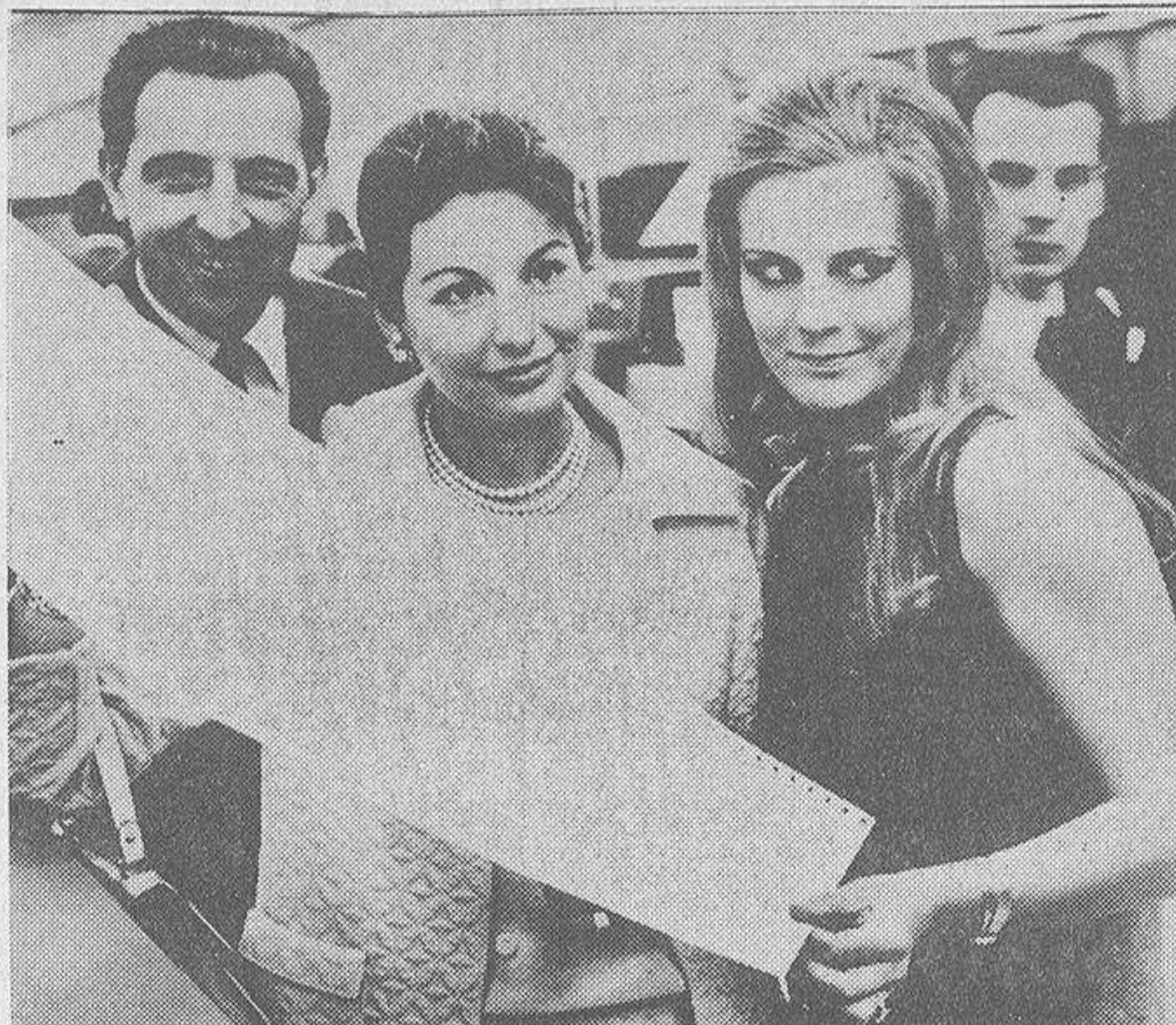
También los computadores han decidido ocuparse de la astrología, y aquí vemos a tres actores alemanes que sostienen un horóscopo usando de un computador que resuelve en segundos lo que a un astrólogo podría llevarle días enteros

ASEGURAN PODER ANUNCIAR ANTICIPADAMENTE EL RESULTADO DE UNAS ELECCIONES, ALGUNOS CRIMENES Y OTRAS TRAGEDIAS