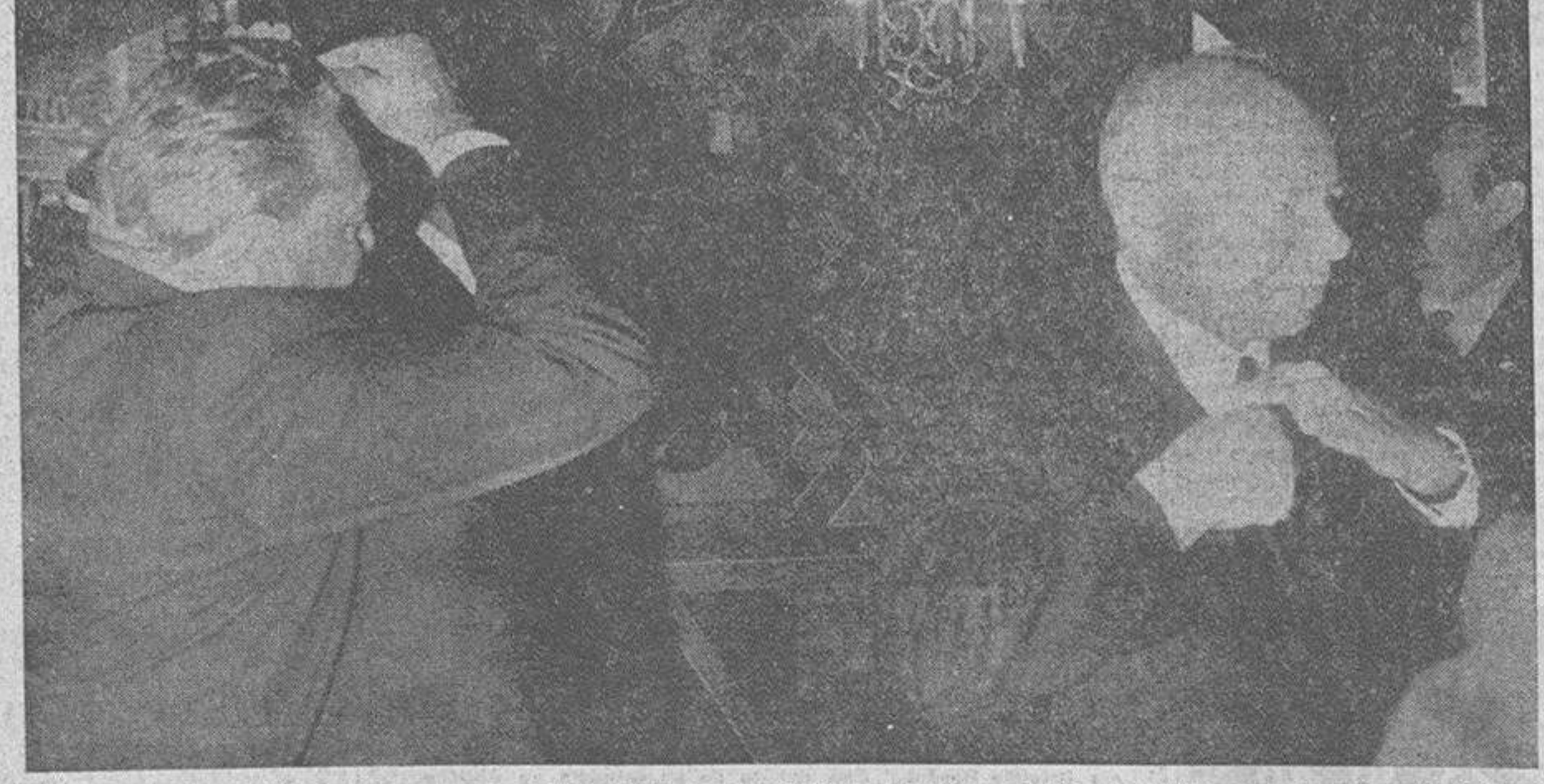
Con motivo de la reciente visita a Moscú del Presidente de la República Francesa, Georges Pompidou, fue obtenida esta fotografía, que acaba de publicar una revista italiana. El reportero indiscreto sorprendió la curiosa actitud de los "tres grandes" soviéticos, a su llegada al vestíbulo de la Embajada francesa, donde Pompidou iba a ofrecer una recepción en su honor. Mientras Kossygin aparece semicubierto a la derecha de la imagen, Brezhnev se pasa el peine por la cabeza, al paso que Podgorny se ajusta la corbata. La revista de Pompidou a la Unión Soviética, criticada en algunos círculos políticos de la capital francesa, se ha traducido en la firma de diversos acuerdos comerciales y culturales, siguiendo el programa esbozado durante el anterior viaje de Charles De Gaulle a Moscú.

DESDE LA REVOLUCION DE 1917 Dieciocho millones de personas, ejecutadas en la Unión Soviética (información en la plana cuatro)