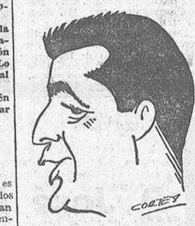
Por MARIA LUISA DURAN MARQUINA

A pesar del materialismo que invade a las gentes cada vez se celebran más las fiestas tradicionales y de modo singular las navideñas.