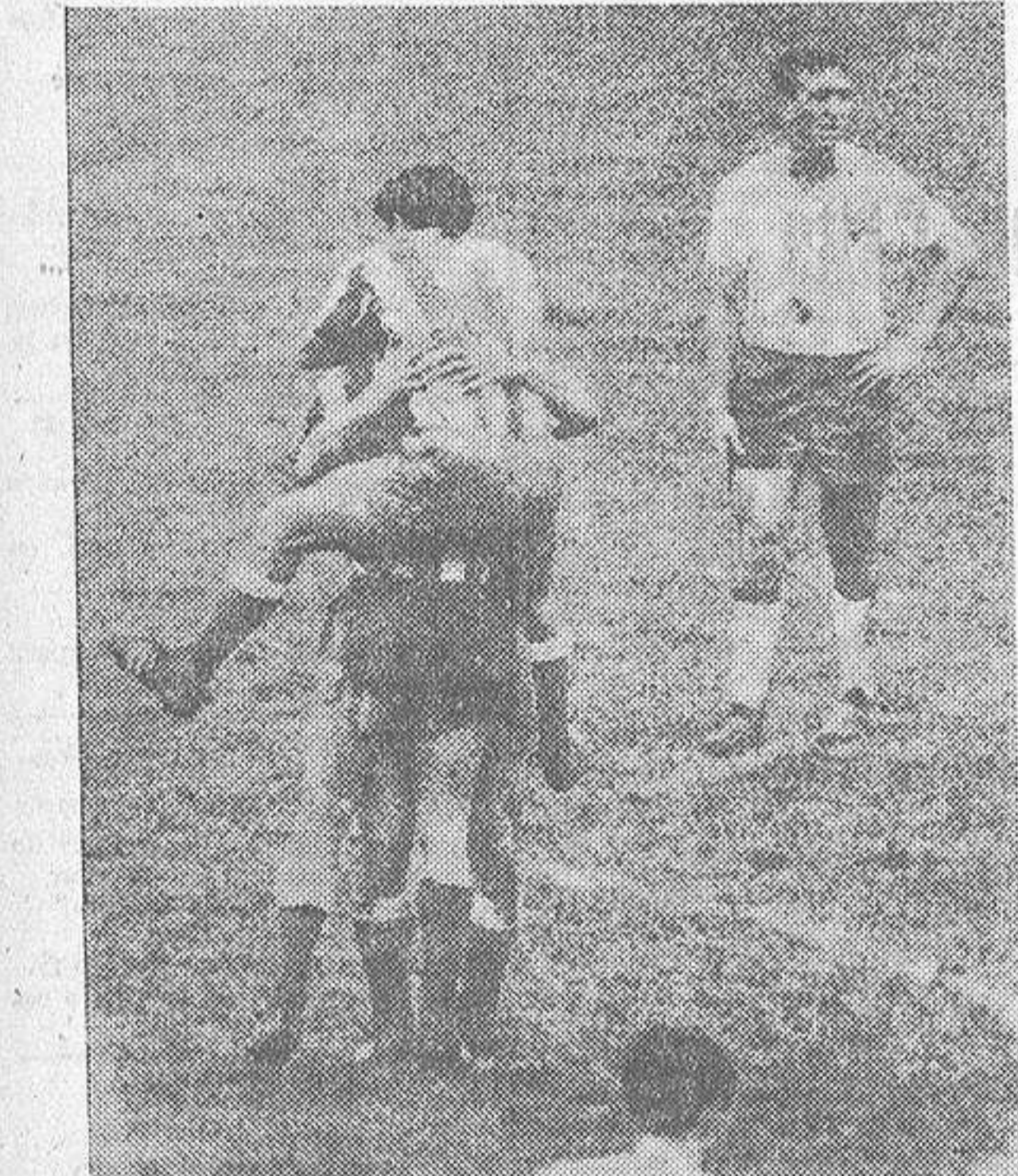
Euforia de los jugadores tras la consecución del primer gol. Esta vez no se trataba de la alegría en la casa del pobre.