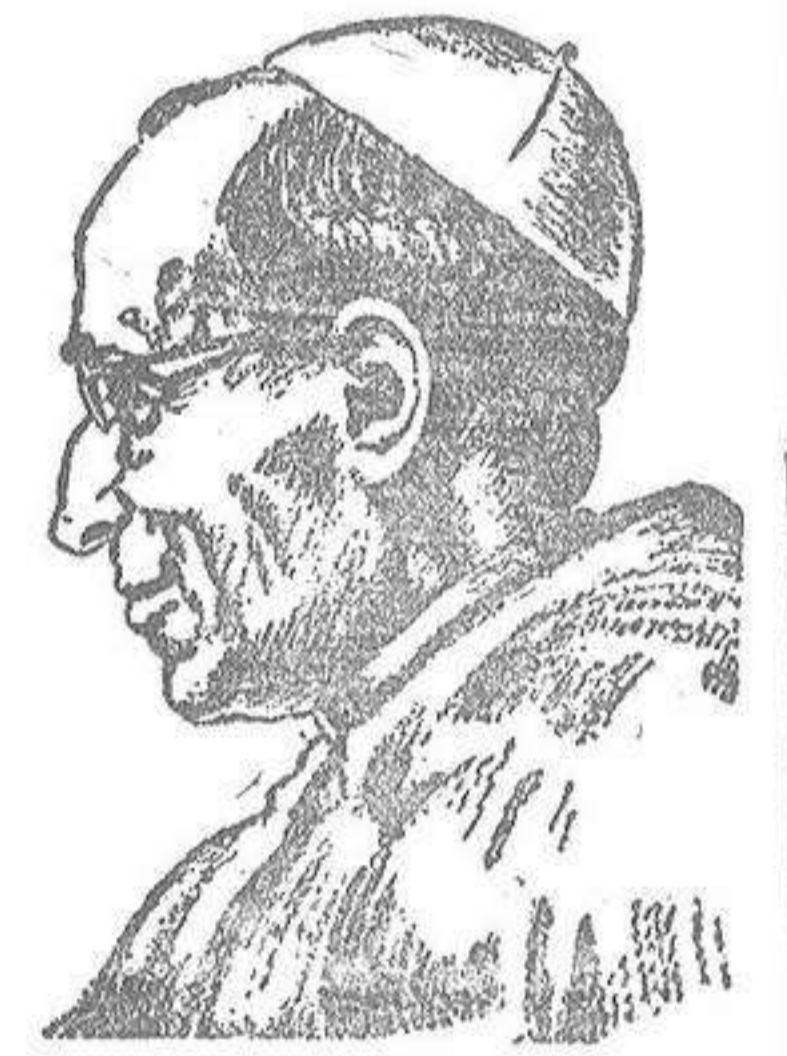
S. S. PIO XII

BOGOTÁ, 16.—Más de un millón de ciudadanos colombianos han acudido a las urnas para elección del nuevo Congreso, el cual se espera marque la tendencia política para la próxima elección presidencial. El ministro del Interior, Urdaneta Arbelá, ha anunciado que hablan sido tomadas todas las precauciones contra cualquier clase de disturbios y que se empleará la fuerza, en caso necesario, para proteger los derechos civiles de los votantes. Los observadores políticos consideran estas elecciones como una prueba entre la fuerza del partido liberal, que se encuentra dividido por luchas internas, y la del partido conservador, mejor disciplinado.—(EFE).