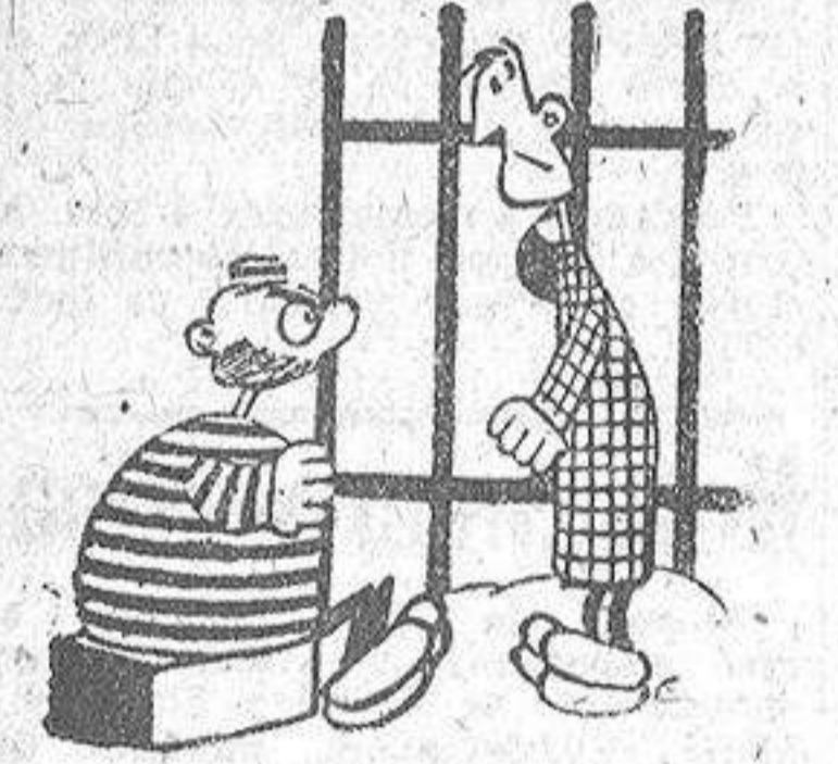
Me han echado ciento cincuenta y dos años, tres meses y un día. Te está bien empleado. A ver si así aprendes para otra vez.