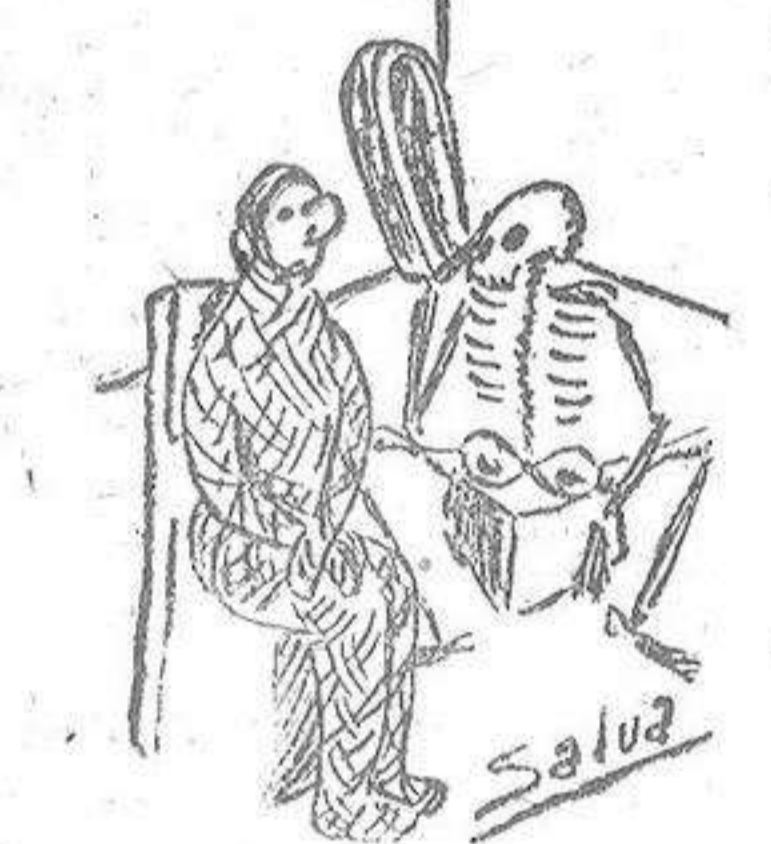
Yo antes también era un real moño; pero la guerra me ha desmoñado mucho.