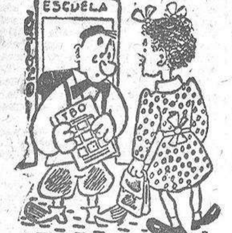
Oye, Tóñin. Si una locomotora lleva andar a las doce y gasta seis kilos de carbón por hora, ¿cuántos kilos habrá gastado a las nueve? ¡Ah, no lo sé! Yo me acuesto a las ocho.