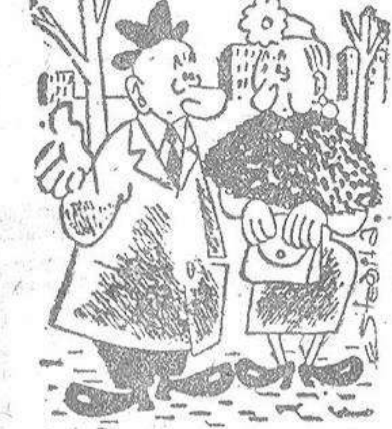
A mí no me gusta comer bombones porque se me mete el estafío entre los dientes.

ANUNCIANTE Comprueba la gran difusión de la HOJA DEL LUNES DE LA CORUÑA