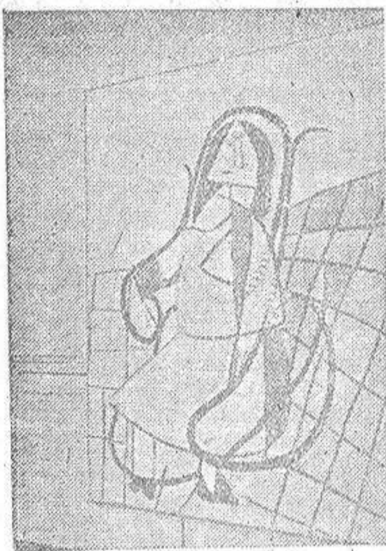
"Mujer en una mecedora"

Reproducimos dos de los cuadros expuestos por Picasso, con la descripción dada por su autor, y que han originado tan fuertes polémicas en el ambiente tranquilo de South Kensington.