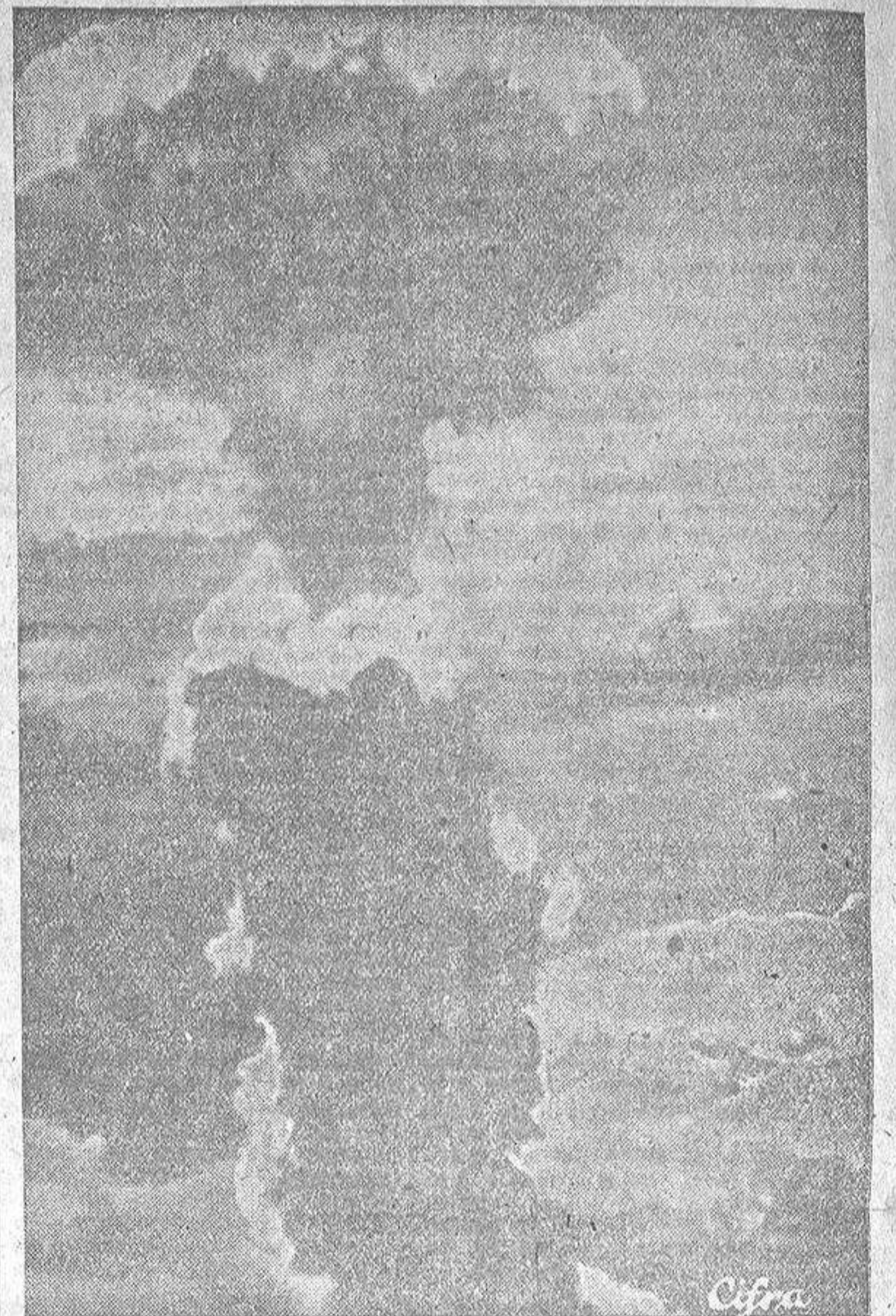
Una de las primeras fotografías de la bomba atómica arrojada en Nagasaki. Tres minutos después de haber sido lanzada, una columna de humo de más de 20.000 pies se eleva sobre la ciudad japonesa

Registremos el "visor" de los bombarderos norteamericanos, cuya destrucción juraban los pilotos realizar antes de que cayera en manos del enemigo; el radiocalizador o "radar", ojo que penetra en la oscuridad, en las nubes y en la niebla; la "Vt. Fuse", arma que Inglaterra empleó contra las "aves" alemanas; el submarino de gran velocidad, mayor en el fondo del mar que en la superficie, capaz de mantenerse sumergido 40 días, último invento alemán de la guerra; el mortero para disparar granadas de dos toneladas que tenían preparado los norteamericanos para atacar las ciudades japonesas; el aparato localizador del sonido, que permite fijar la posición de un cañón que está disparando a kilómetros de distancia; el "fido" dispersa nieblas, que ha motivado una invención análoga con la que los labradores podrán di-