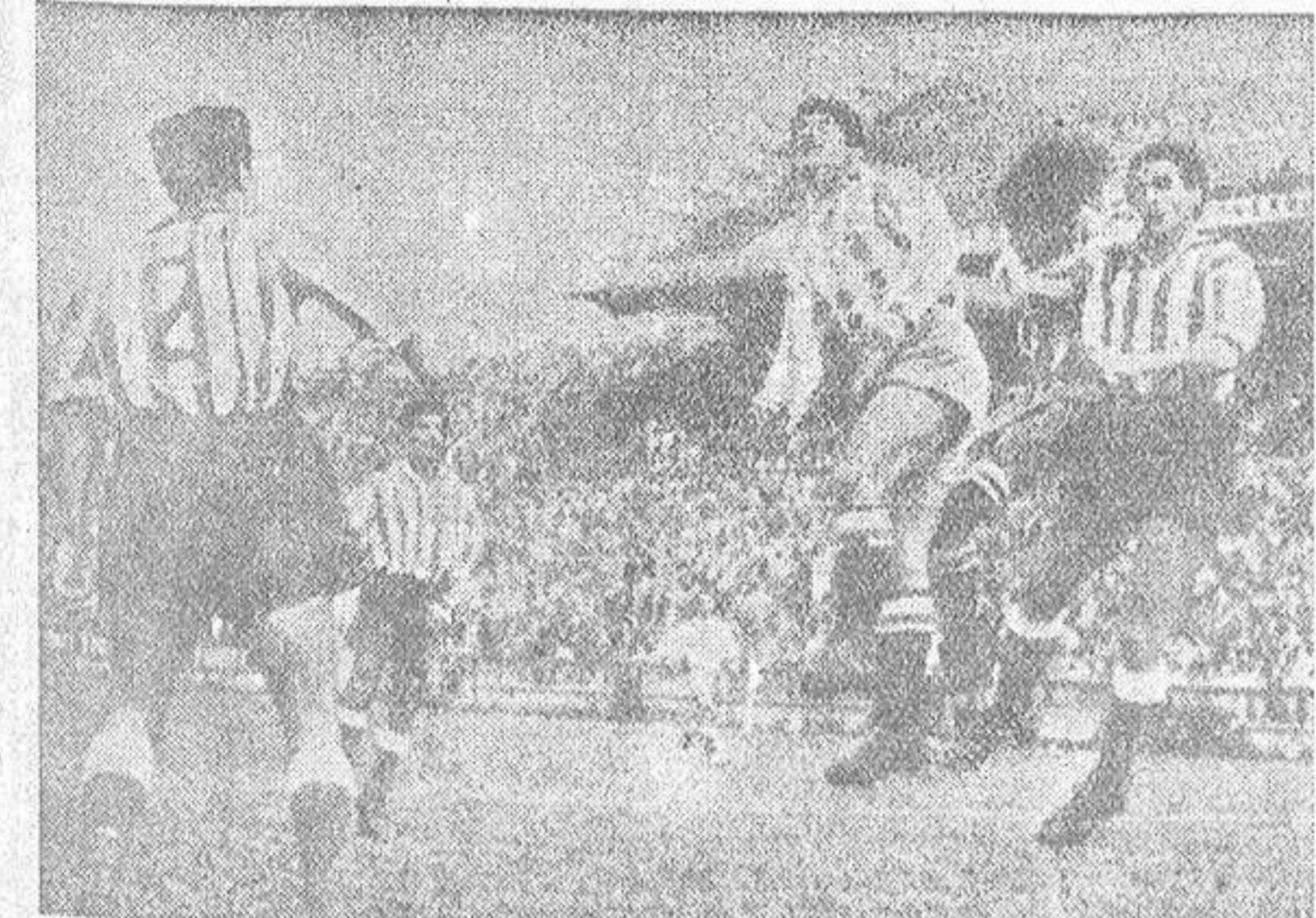
Acoso contra la puerta atlética. Arsenio, a pesar de la dura oposición adversaria, consigue rematar

forzó su sistema defensivo y desplazó hacia adelante, a la (busca de oportunidades, a los cuatro delanteros. Le dió buen resultado al Atlético el dispositivo, como se verá. El Deportivo dominó durante la casi totalidad de los noventa minutos, pero favoreció la táctica rojiblanca en una tarde en que los delanteros coruñeses volvieron a hacer "gala" de su inoperancia ante la meta adversaria.