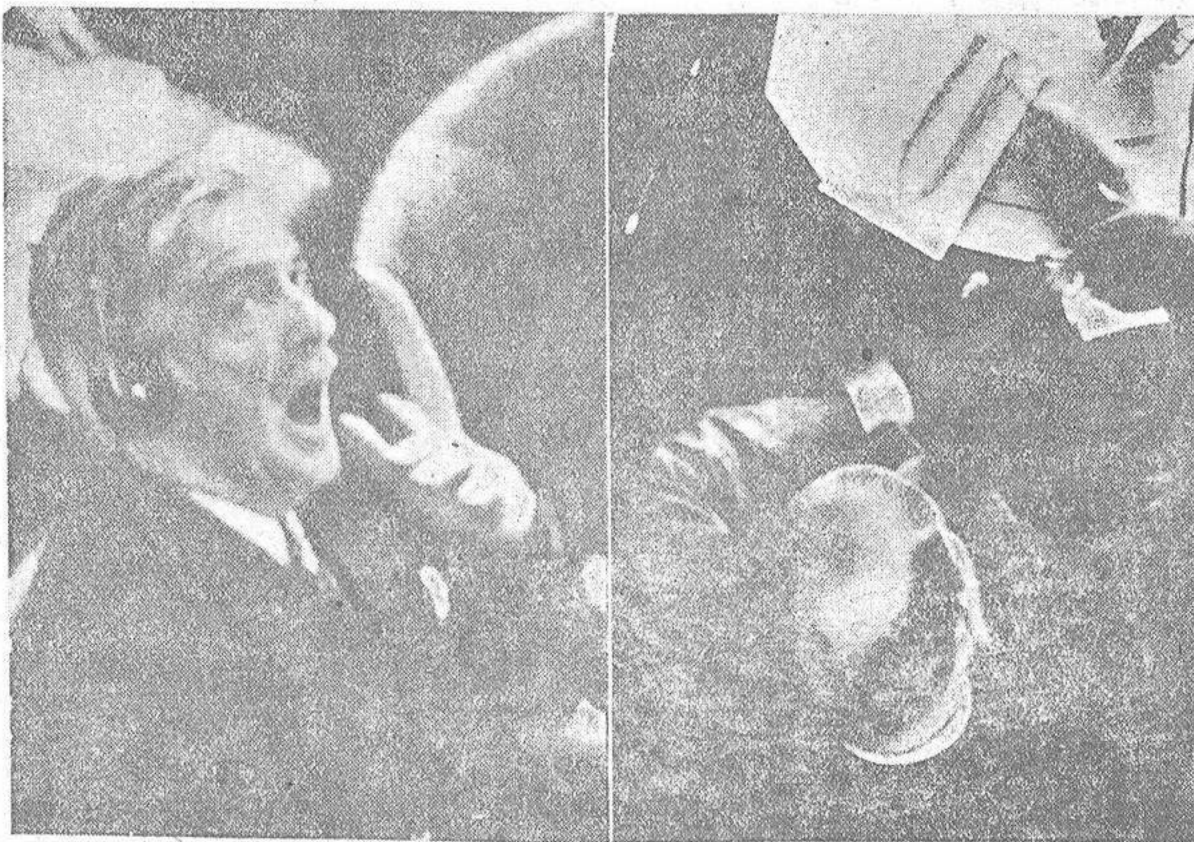
En París, la Asamblea General de las Naciones Unidas está trabajando, a todo gas para arreglar el mundo. En una foto aparece Mr. Eden, ofreciendo su juicio al discurso de Vichinski. En la segunda, el delegado uruguayo dibuja, al papecer, una bomba atómica, en el curso de uno de los debates.