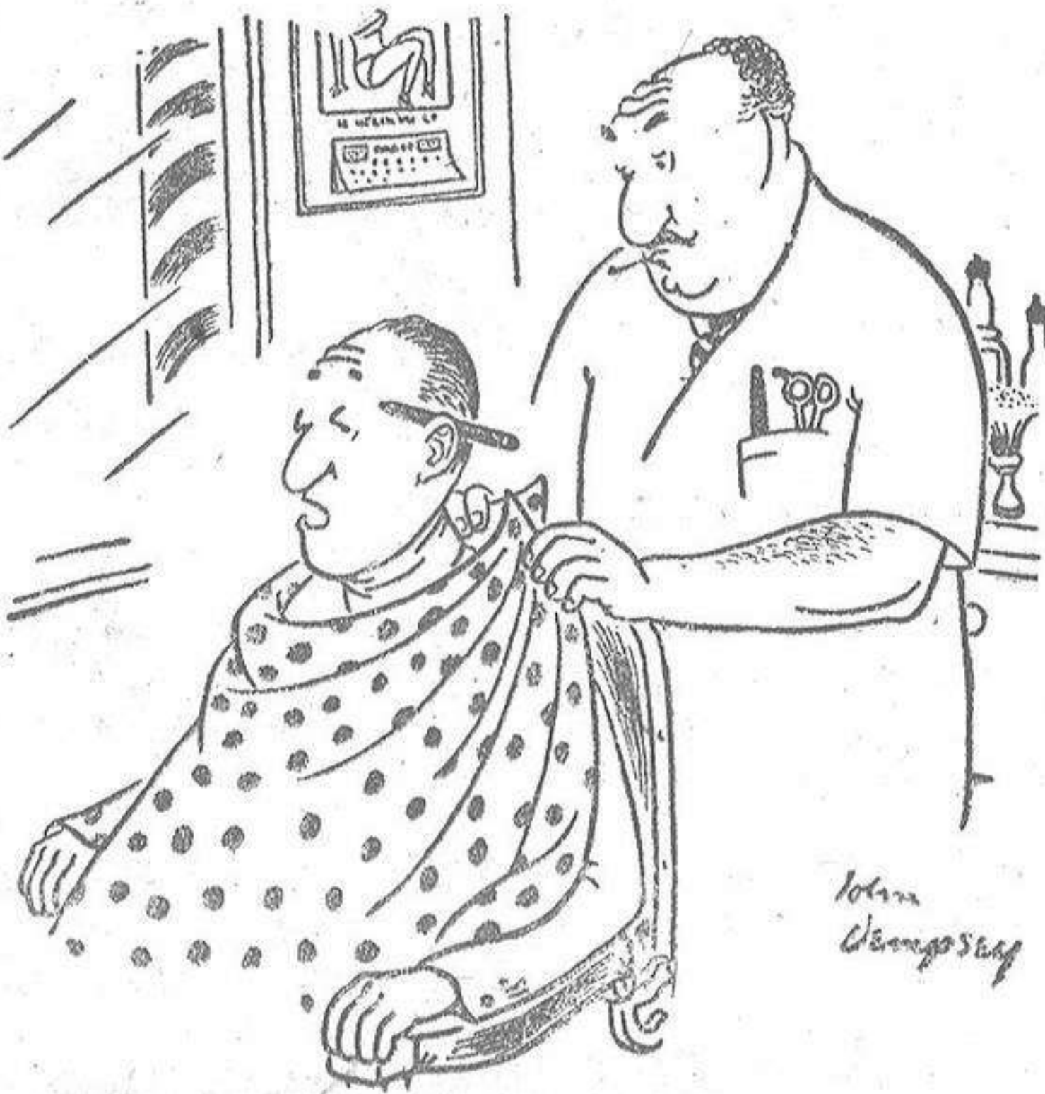
—Me recorta un poco el pelo por encima y me anja el lápiz.