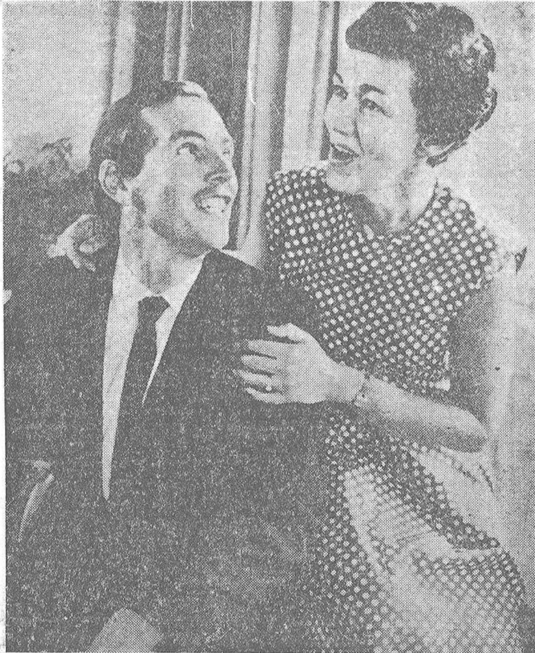
He aquí al profesor Christian Barnard, que se ha convertido en figura mundial después de sus operaciones de trasplante de corazón, efectuadas en el Hospital "Groot Schurch", de Ciudad del Cabo. Aquí vemos a Barnard, en compañía de su esposa, lejos del quirófano y con un aire muy familiar. El ilustre cirujano ha recibido una ventajosa oferta para trasladarse a los Estados Unidos y, según informaciones procedentes de África del Sur, nada de extraño tendría que "cambiara de aires". Al tiempo que se habla de esto, son también numerosas las críticas—algunas expuestas por eminentes colegas suyos—sobre la supuesta inmoralidad que entrañan estas intervenciones quirúrgicas.