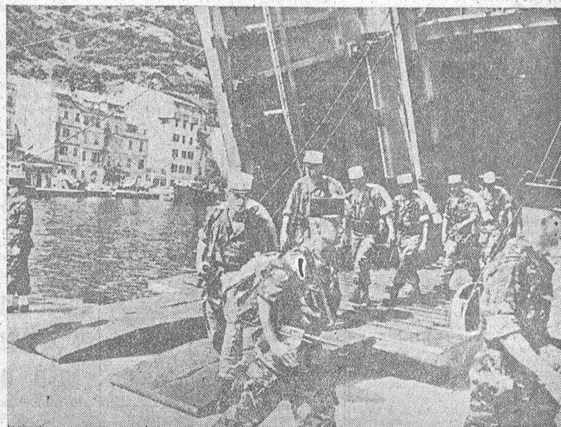
La Legión Extranjera francesa ha tenido que abandonar sus acuartelamientos de Side-Bel-Abbes, en Argelia. Esta marcha ha sido hecha con verdadero dolor de corazón; pero los acuerdos de Evian para nada tienen en cuenta las páginas de bravura escritas por estos combatientes anónimos en el Sahara. Los legionarios han sido trasladados a Córcega, y la foto recoge el momento de su desembarco en Bonifacio, donde han sido objeto de una calurosa acogida.