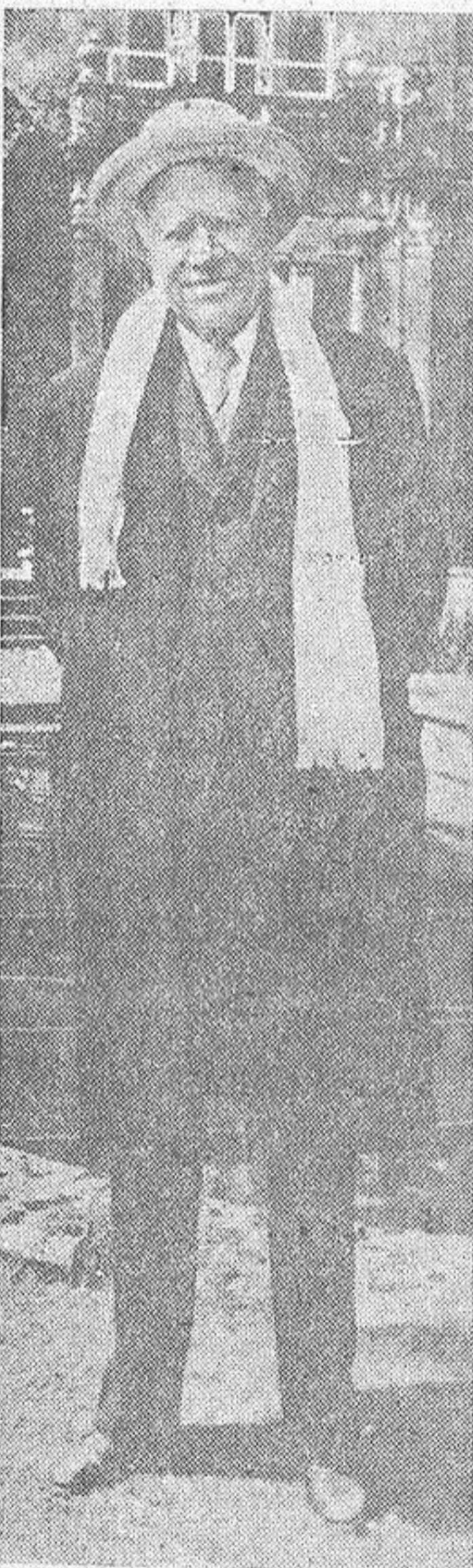
He aquí una reciente fotografía de Lord Beaverbrook, magnate de la Prensa británica y uno de los hombres excepcionales de nuestro tiempo. Dueño de una gran fortuna y propietario de un "trust" periodístico que edita el setenta por ciento de los treinta millones de ejemplares que leen los ingleses, el "Daily Express" es su órgano más caracterizado. Lord Beaverbrook, encarnizado enemigo de la idea europeísta y ardiente defensor de la insularidad británica, acaba de iniciar una campaña de propaganda contra el ingreso de su país en el Mercado Común.

Asistieron 300 delegados del distrito marítimo ferrolano