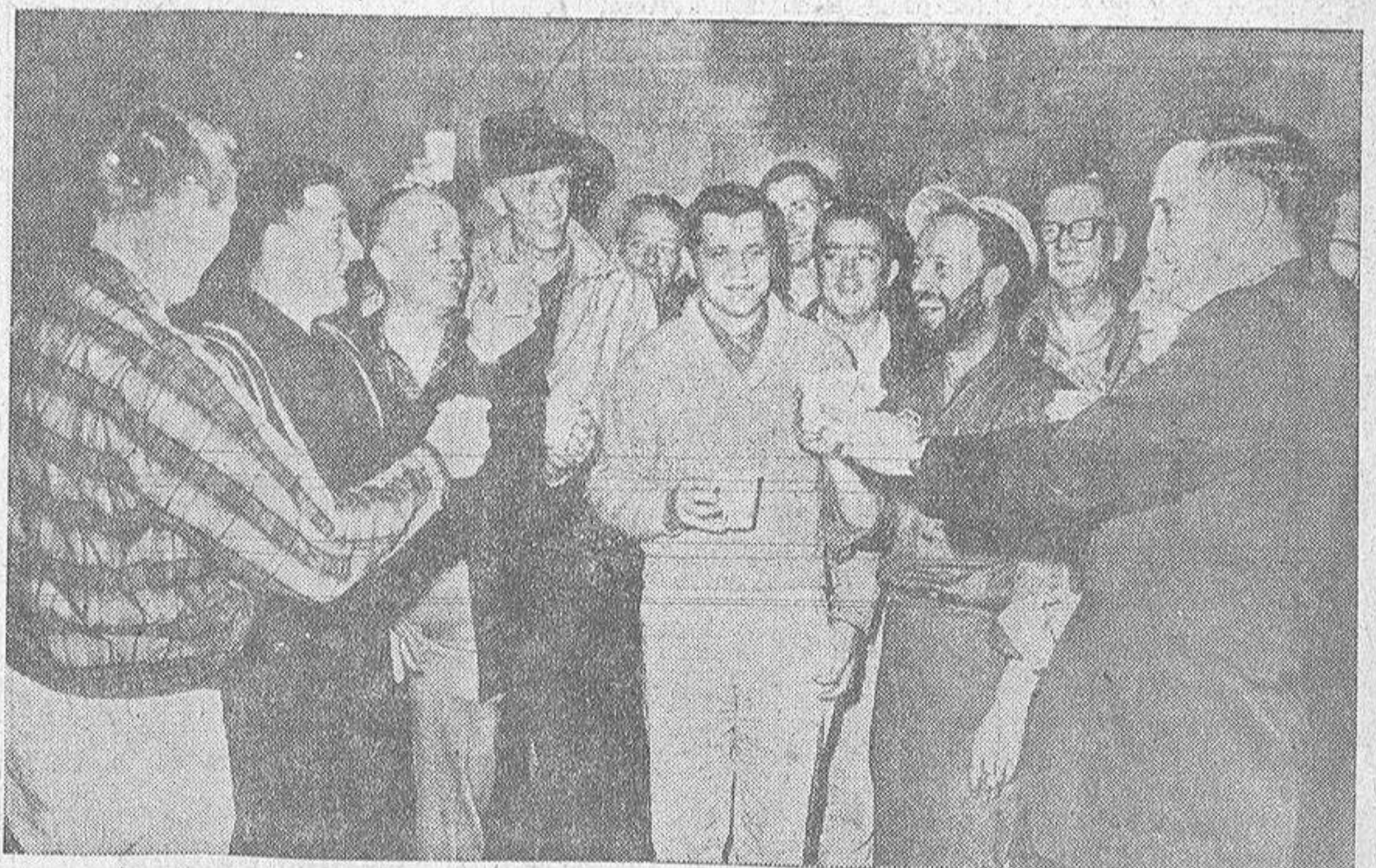
Gary Powers—en el centro de este grabado—acaba de ser festejado por un grupo de amigos al regresar a su pueblo natal, Pound, en Virginia. El piloto del "U-2" derribado en la Unión Soviética, durante un mes ha tenido que sufrir los interrogatorios sobre su comportamiento en Rusia. La encuesta ha concluido satisfactoriamente y Powers recibirá todos los sueldos que se le adeudan.