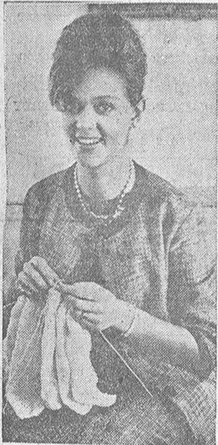
Birgitta de Suecia, esposa de Johan Georg Hohenzollern, acaba de alumbrar su primer hijo. Aquí la vemos en su casa de Mónaco confeccionando prendas de punto para el futuro heredero. Por cierto, que Birgitta, ahora madre feliz, está ya muy lejos de ser aquella Princesa alocada que un día fue elegida "reina del carnaval monegasco".

PARIS, 8.—El ministro del Interior informa a última hora que alrededor de un 75 por ciento del Censo electoral de 27 millones de personas han emitido su voto en el referéndum celebrado hoy sobre el futuro de Argelia.