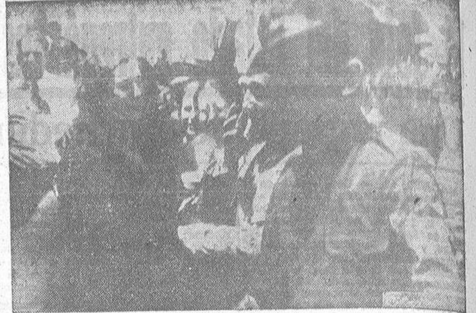
El Generalísimo Franco a su llegada a Ceuta para tomar el mando supremo del Ejército (Foto, Cifra).