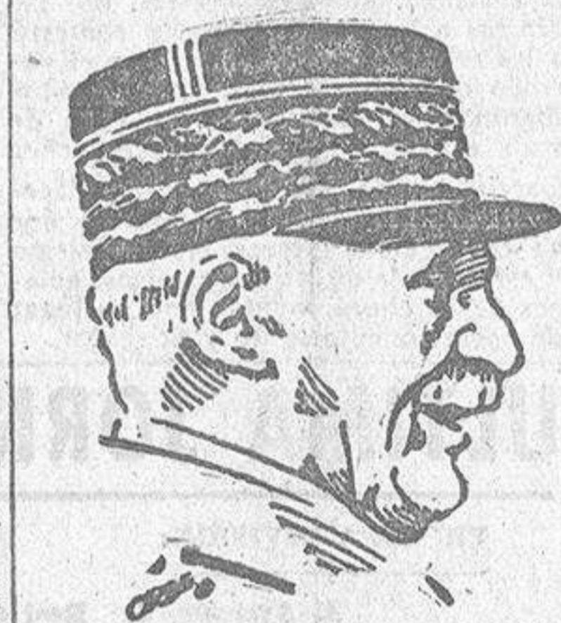
VICHY, 4.—En su mensaje por radio al pueblo francés, el mariscal Pétain dijo: