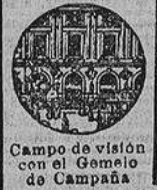
Campo de visión con el Gemelo de Campaña