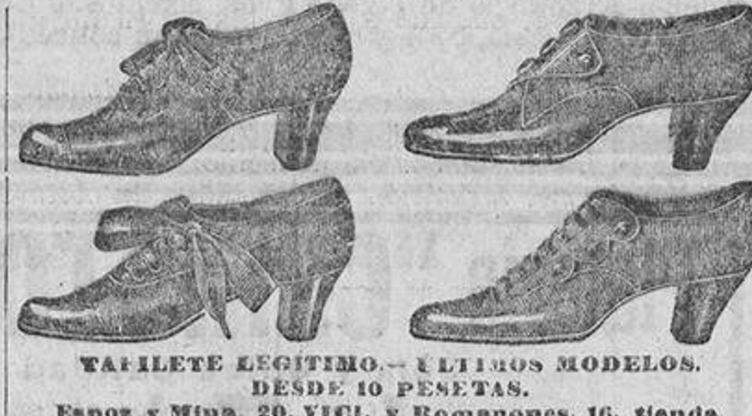
TAFLETE LEGITIMO.— ÚLTIMOS MODELOS. Español y Misa. 20. Vici y Romanones. 16. tienda.