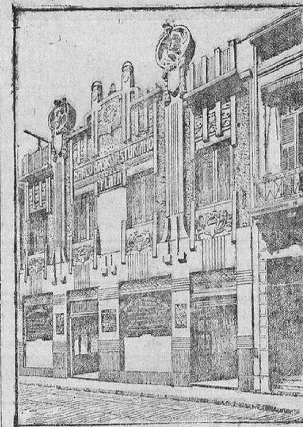
EDIFICIO DEL BANCO

BUENOS AIRES.—Calle Maipú, 73 al 87. Casilla de Correos, 619