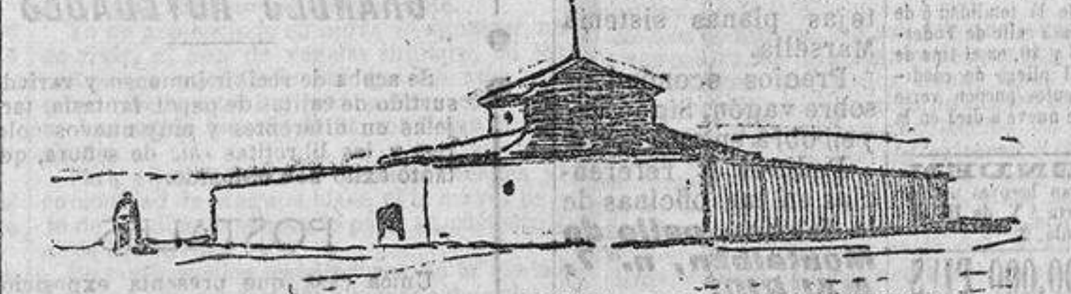
Polvorin semejante al destruido.