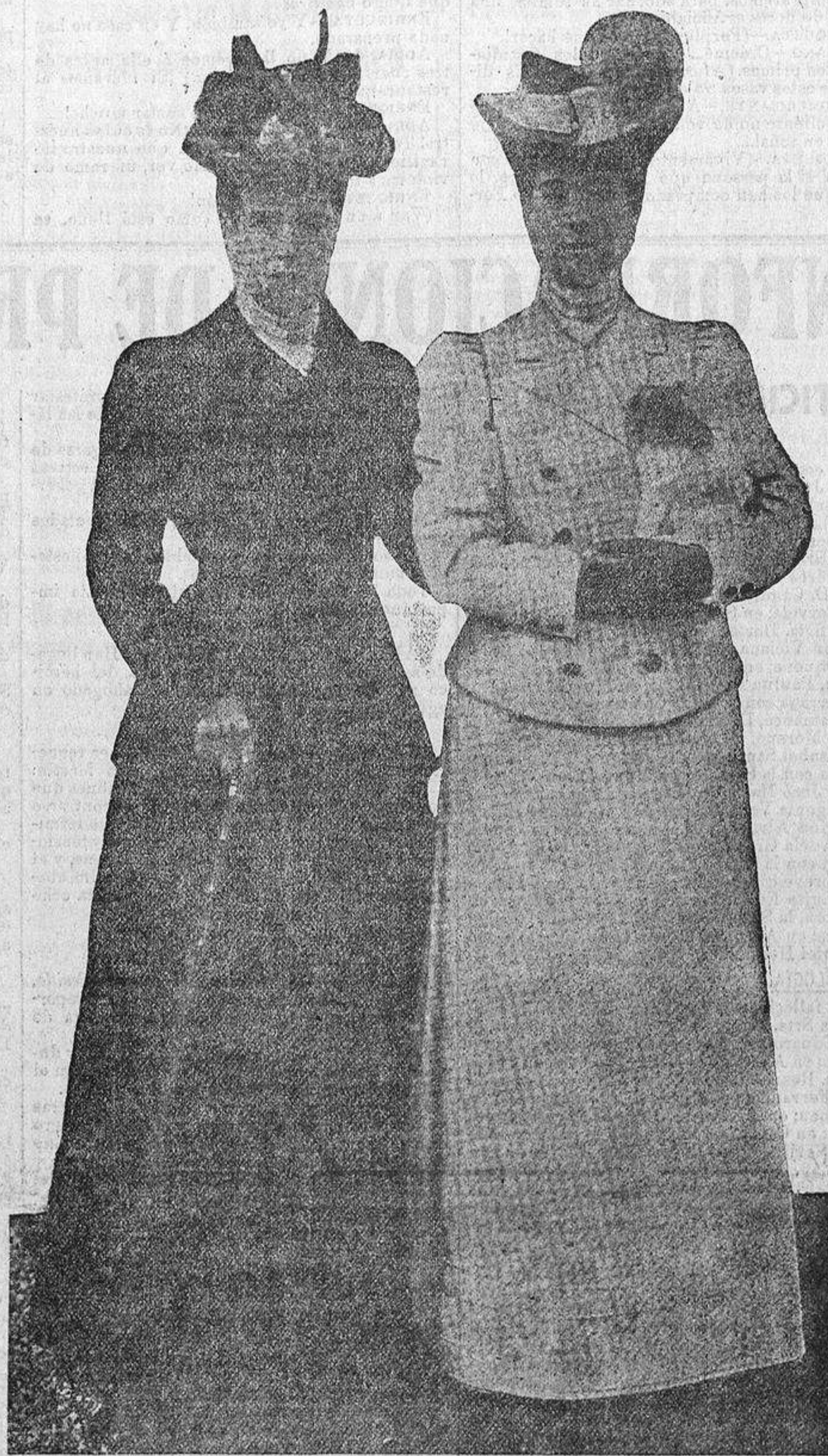
SAN PETERSBURGO. Es inexacto en absoluto que se haya atentado contra la vida de la Emperatriz madre, que regresará a Copenhague dentro de breves días.—El grabado es la última fotografía de la Emperatriz viuda de Rusia, vestida de negro, acompañada de su hermana la Reina Alejandra de Inglaterra.