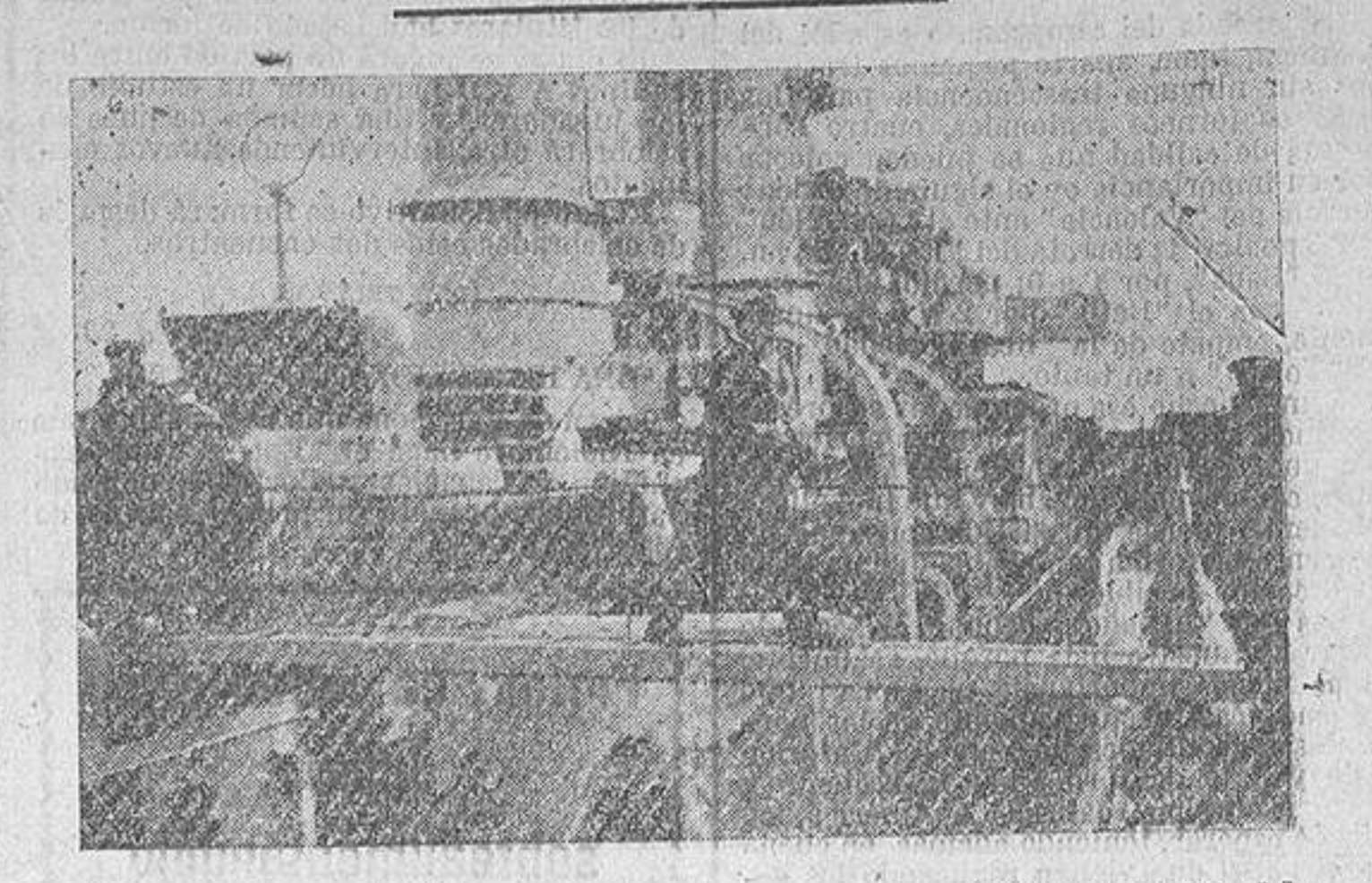
Wilhenssaffen.—El jefe de la flota alemana, almirante Mommsen, hijo del famoso sabio y escritor, saliendo del crucero EMDEN