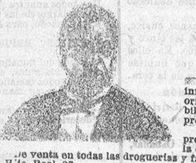
Se vende en todas las droguerías y farmacias acreditadas de España, y en esta ciudad en la droguería de Besoana, H. Jo. Real, 27.

Landós, carretelas, familiares, cestos, berlinas para viajes particulares y paseos. Omnibus á la Estación