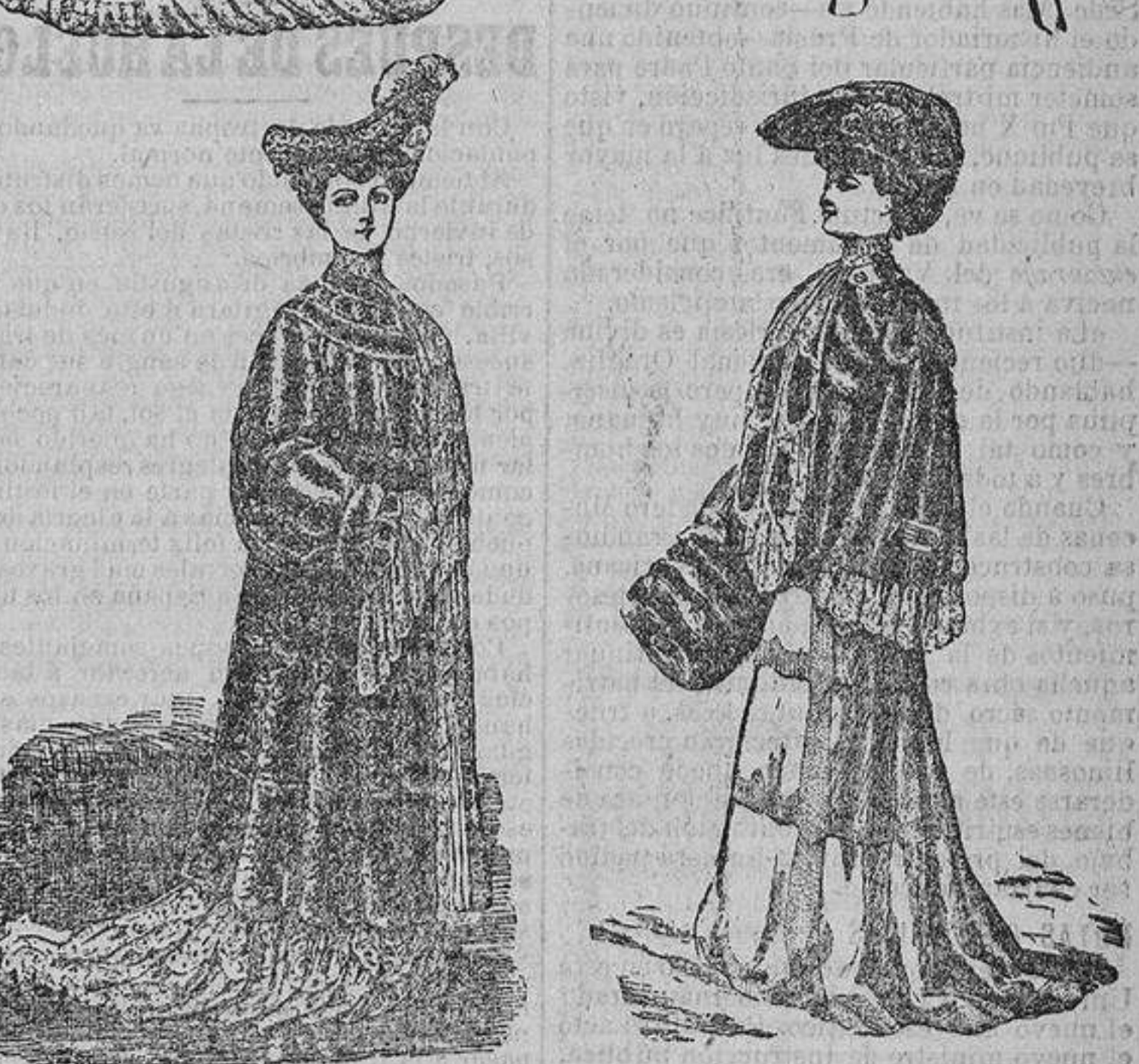
Los últimos modelos.

Manuel BUENO EL TUMOR DEL KAISER Comentarios pesimistas