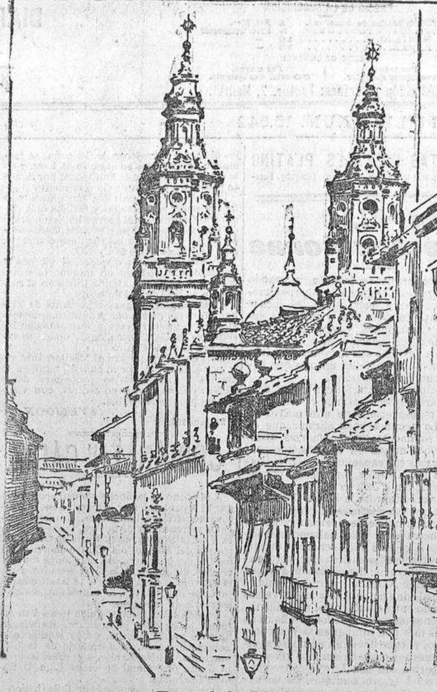
Torres de la Colegiata.

bonito castillo, cuyos adornos consisten en cañones simulados, follaje y banderas españolas.