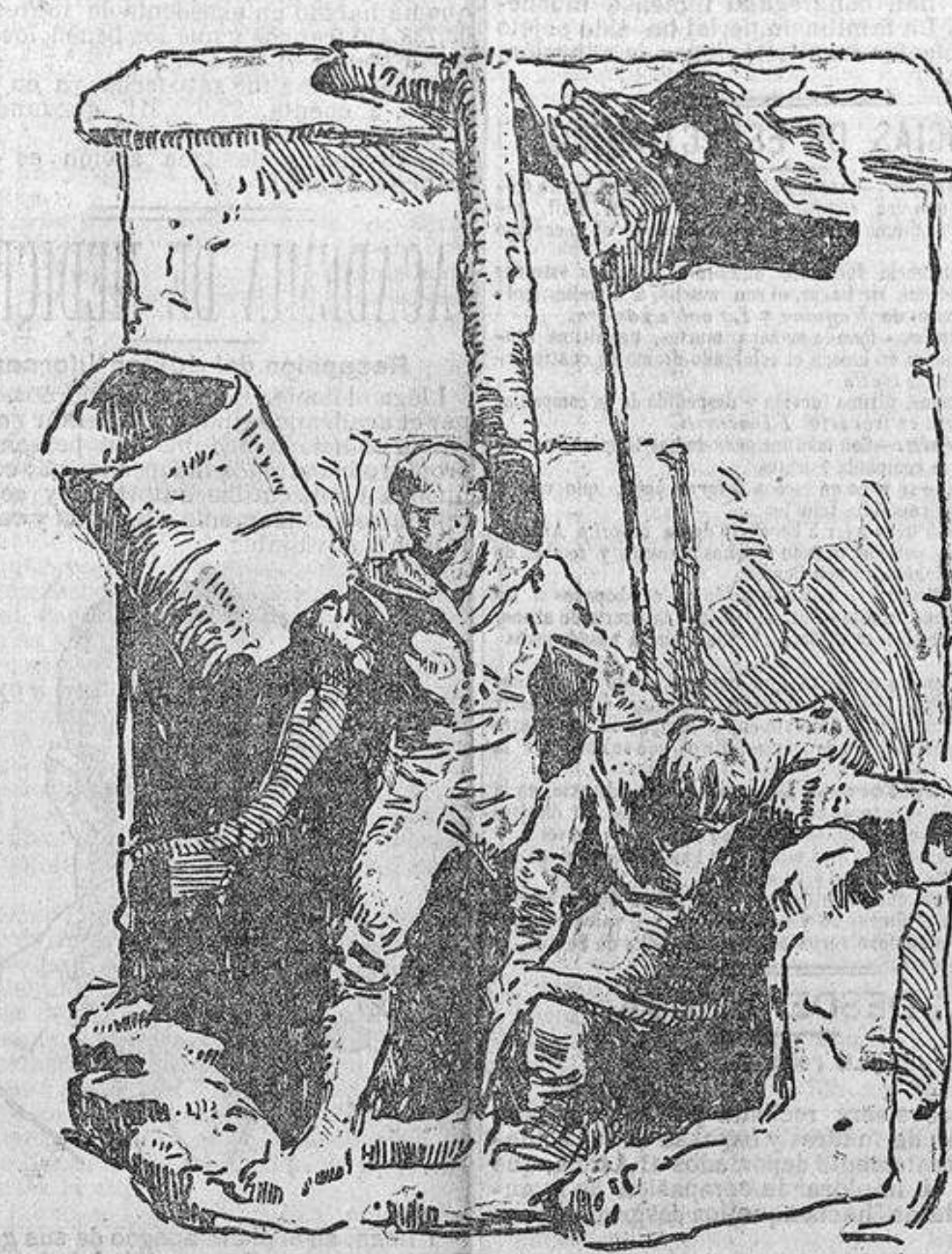
Proyecto premiado: TANTO MONTA (fragmento titulado «Cavite-Santiago de Cuba»).

En el local de la Asamblea de la Cruz Roja se reunió anoche, bajo la presidencia del general marqués de Polavieja, la Junta Central del Monumento Nacional a los soldados y marinos muertos en las campañas de Cuba y Filipinas. Después de amplia discusión sobre la conveniencia de desecher los modelos presentados, prevaleció la idea, por gran mayoría, de proceder a la elección de proyecto en votación secreta. Verificada ésta, el escrutinio dió el resultado siguiente: Proyecto señalado con el lema Tanto monta , 41 votos; Santiago , 5; Batavia , 2; Pro patria, Blanca y Patria y héroes , un voto cada uno. En el acto se proclamó la elección a favor del Tanto monta , procediéndose a la apertura del sobre correspondiente, resultando ser los autores del indicado proyecto los señores