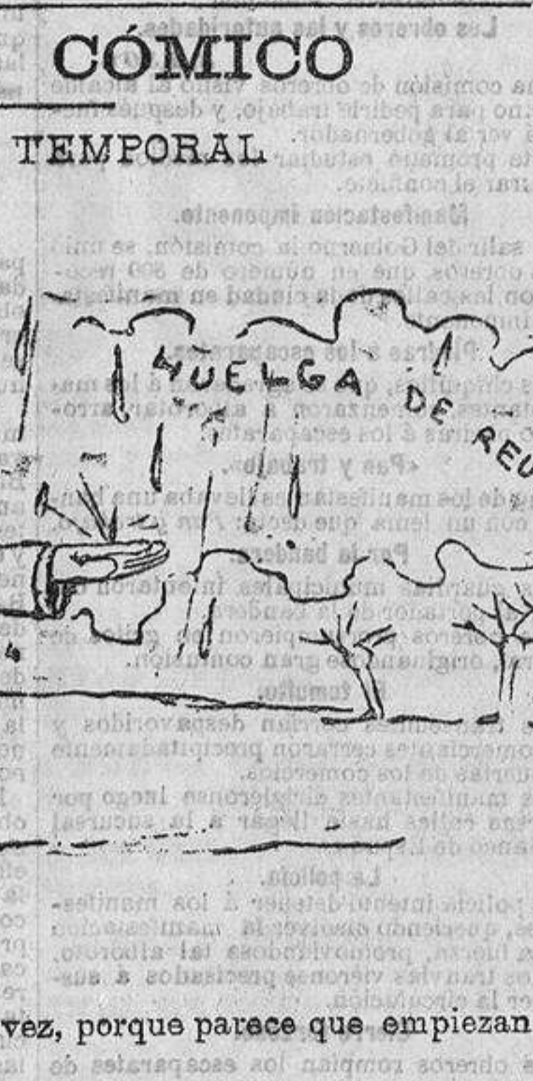
—Abriremos los paraguas otra vez, porque parece que empiezan a caer gotas.

PERFIL COMICO. SIGUE EL TEMPORAL. «Mejor que mejor! Pensaran todo así, mi querido hijo, y otra serie la suerte de este país. Luchar lejos... Vivir lejos... ¡No! Luchar aquí, y aquí vivir, y aquí trabajar»