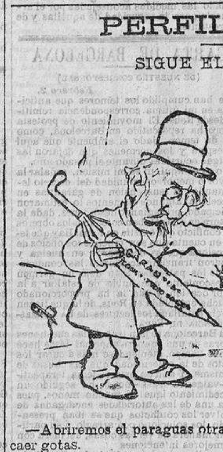
—Abriremos los paraguas otra vez, porque parece que empiezan a caer gotas.

ULTIMOS CAMBIOS. Barcelona 4, 5, 5 t. Interior, fin de mes, 76-47.—Nortes, 63-90.—Alicantes, 99-30.