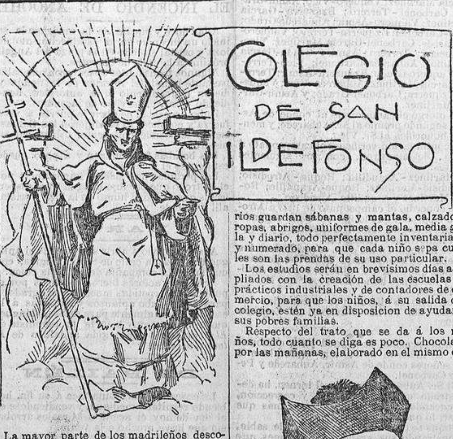
COLEGIO DE SAN ILDEFONSO