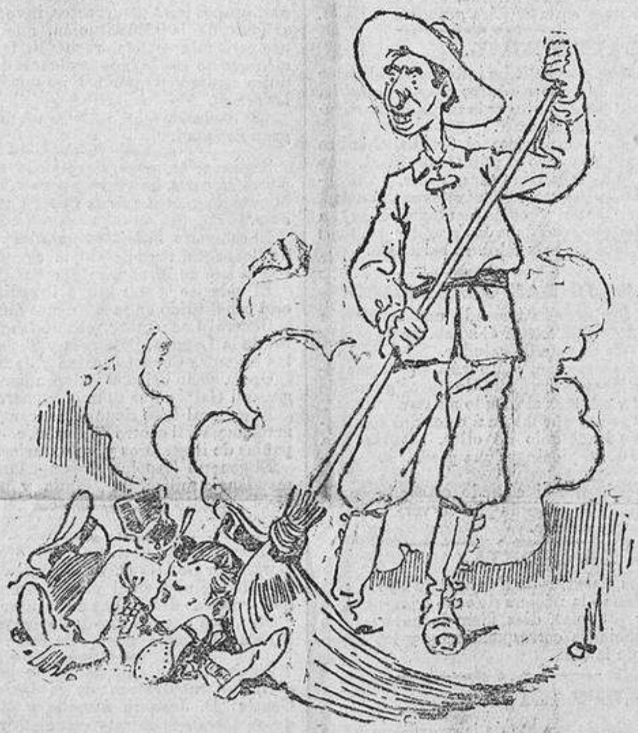
La lógica del artículo de Nakens.