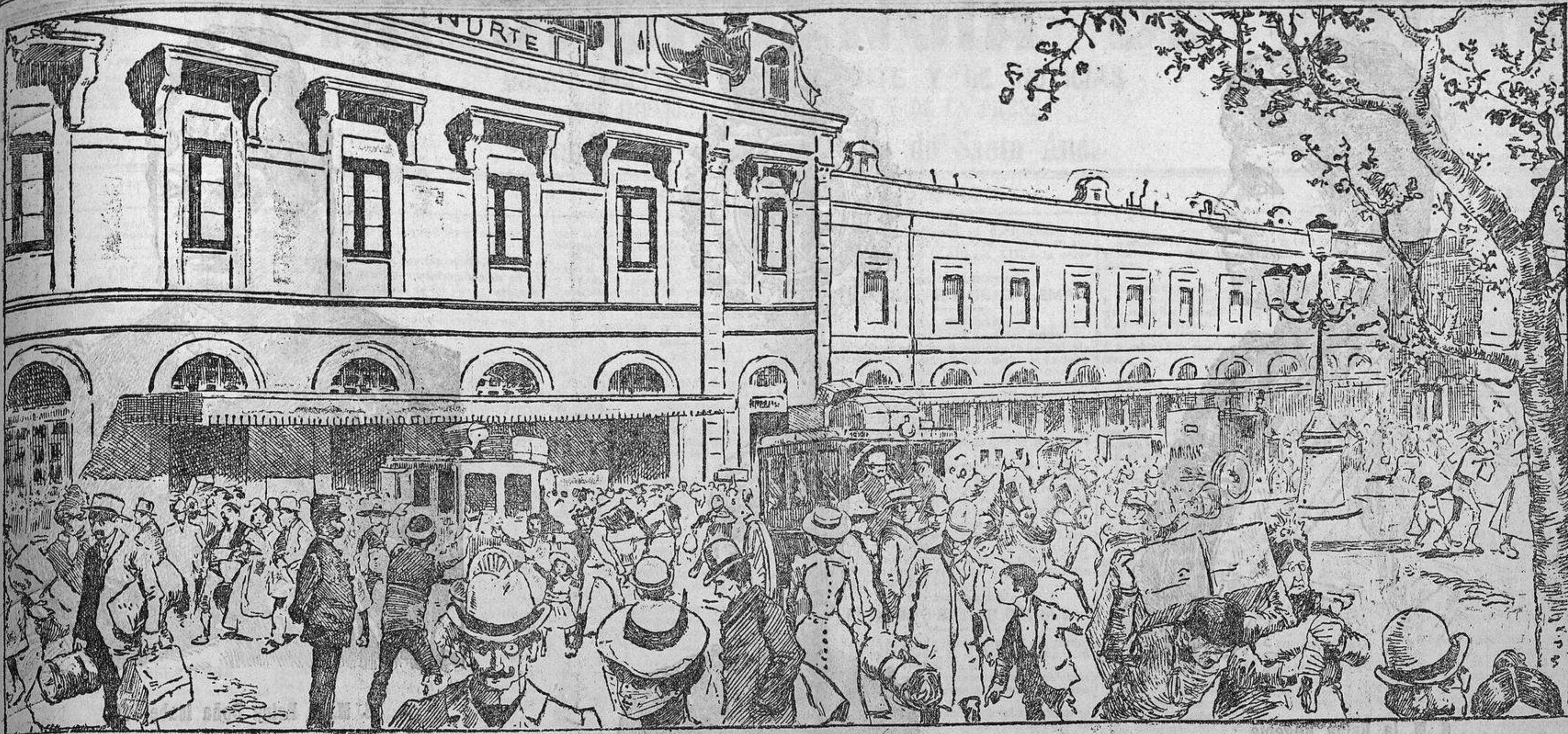
Estación del ferrocarril del Norte.