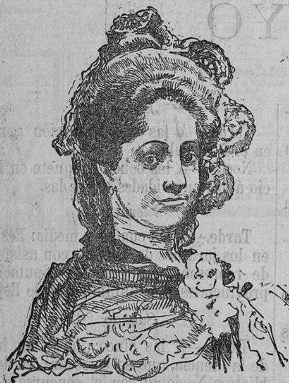
S. A. la Infanta Doña Maria Teresa.