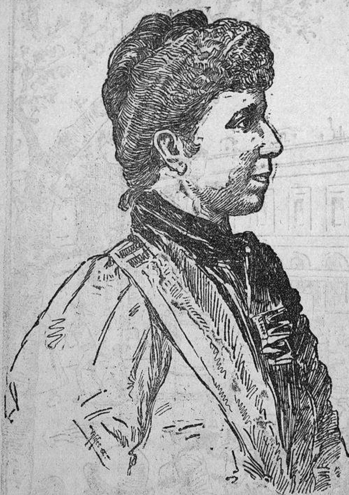
S. M. la Reina Regente.