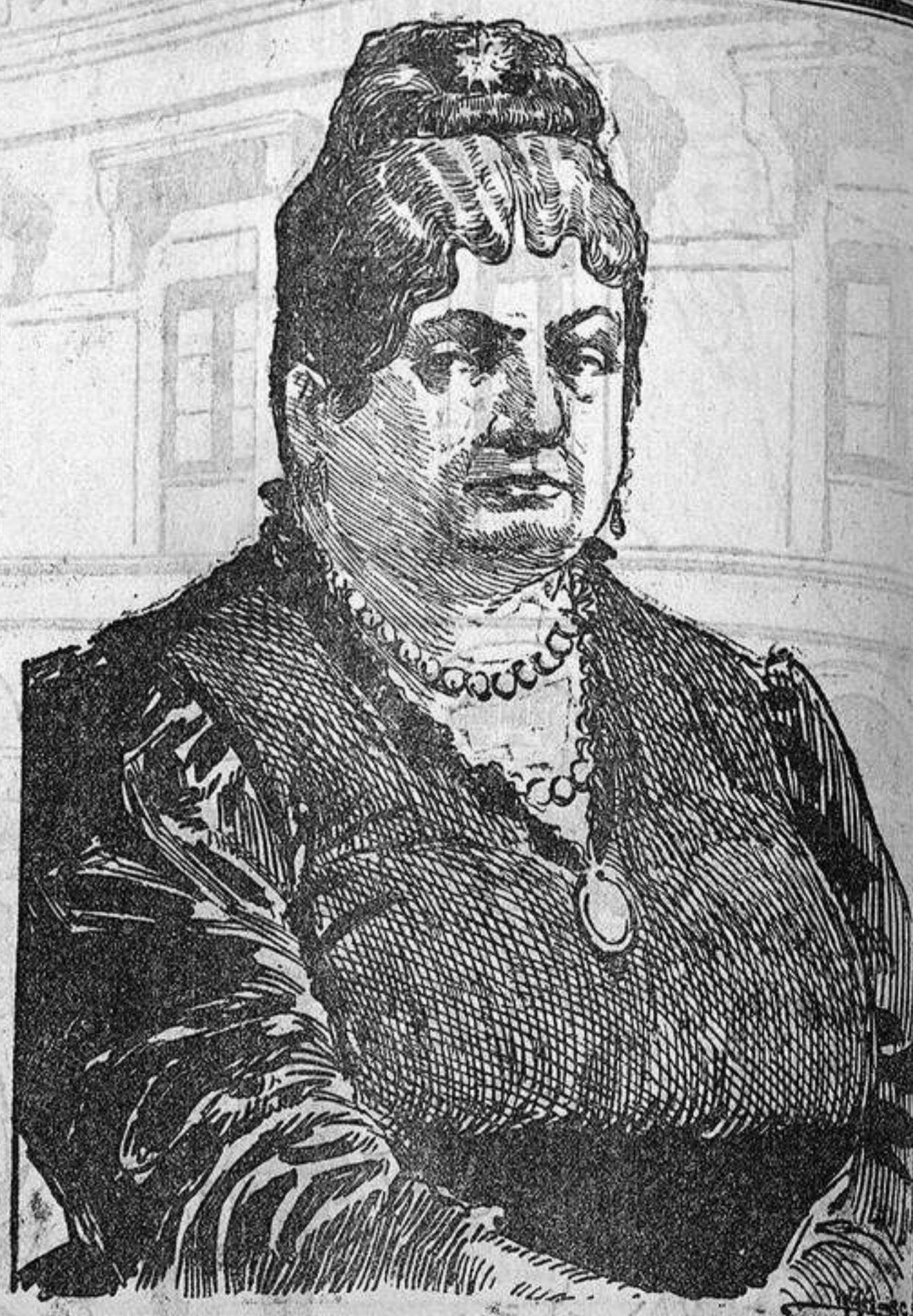
S. M. la Reina Doña Isabel II