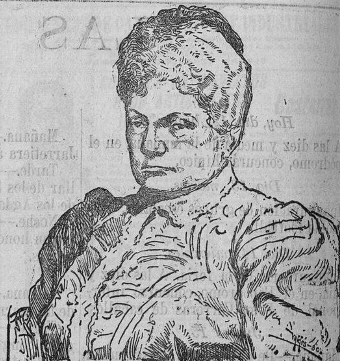
S. A. la Infanta Doña Isabel.