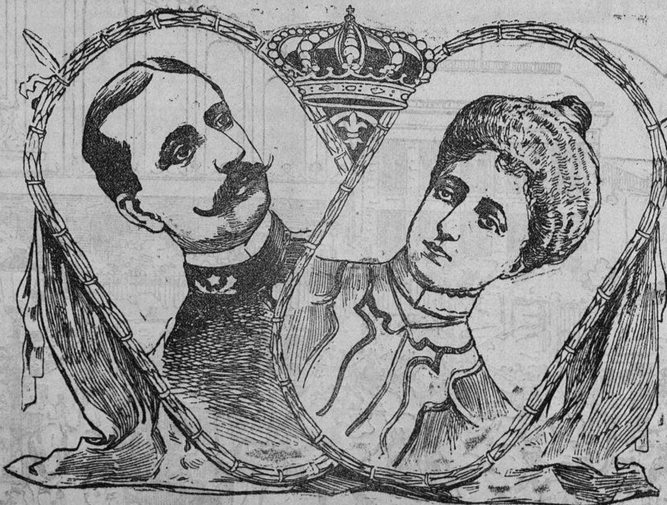
SS. AA. RR. los Príncipes de Asturias.