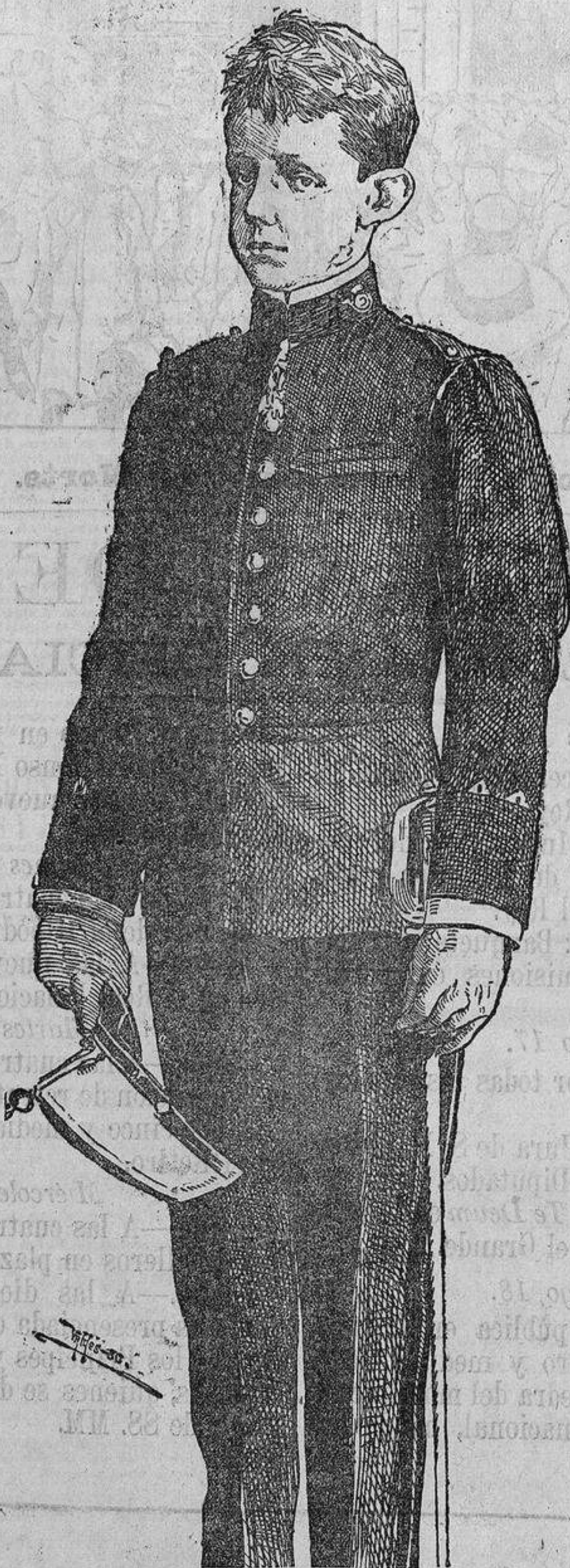
S. M. el Rey D. Alfonso XIII.