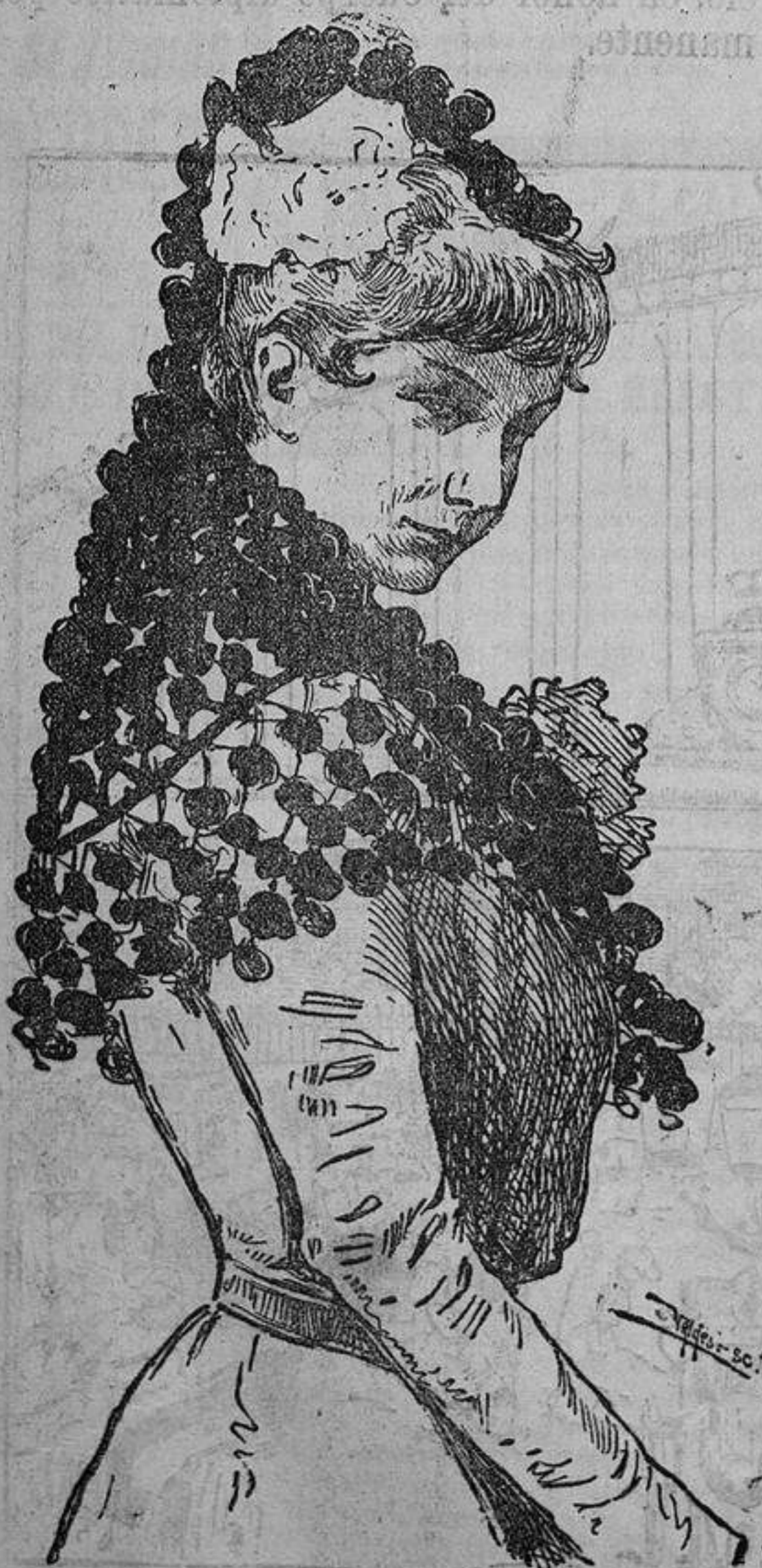
S. A. la Infanta Doña Eulalia.