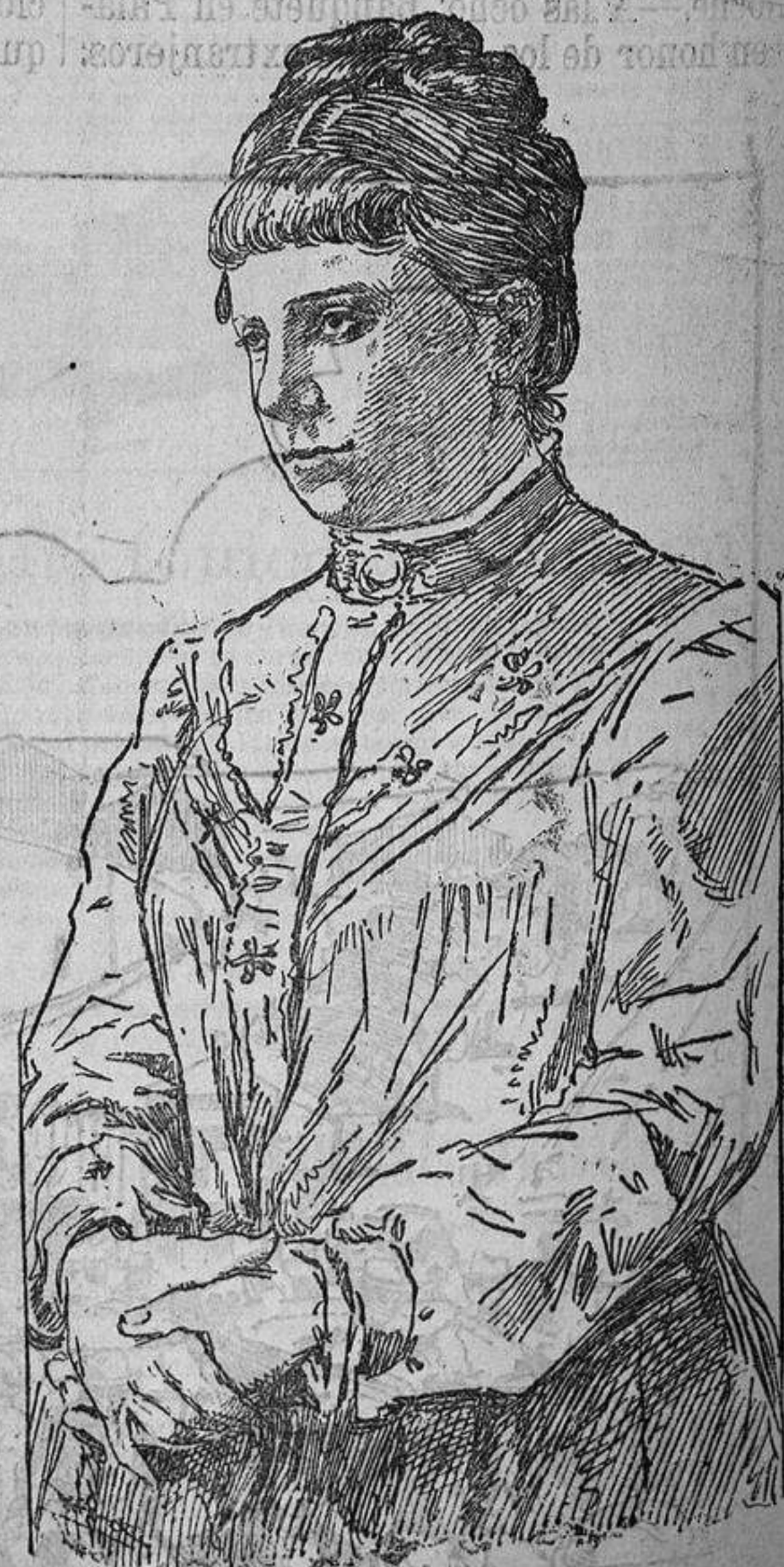
S. A. la Infanta Doña Paz.