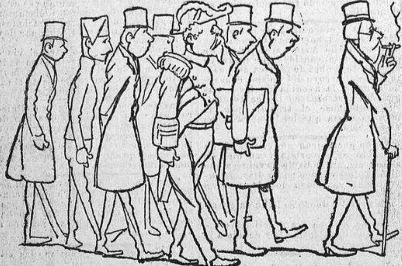
Un personaje político de los tiempos de la primera regencia.