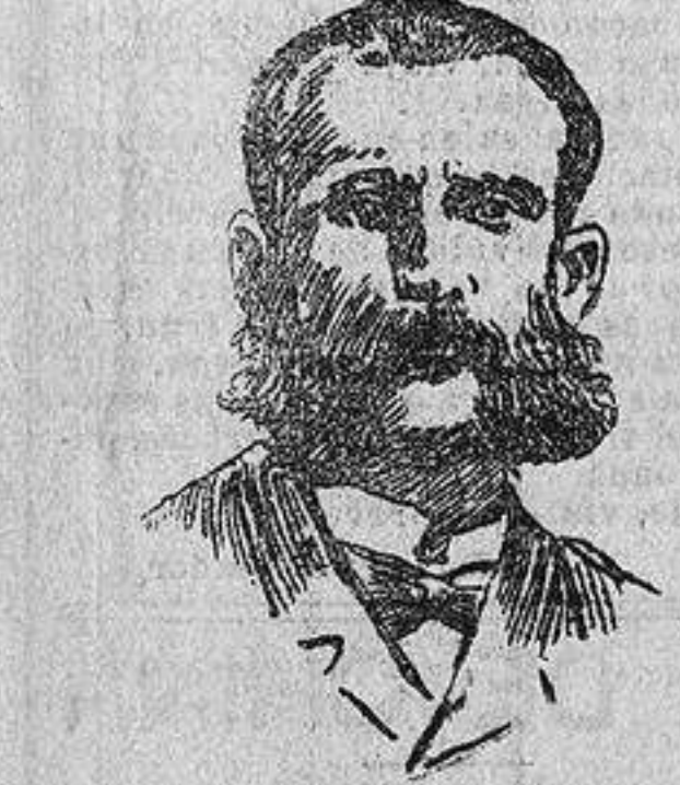
Señor Colón (España)