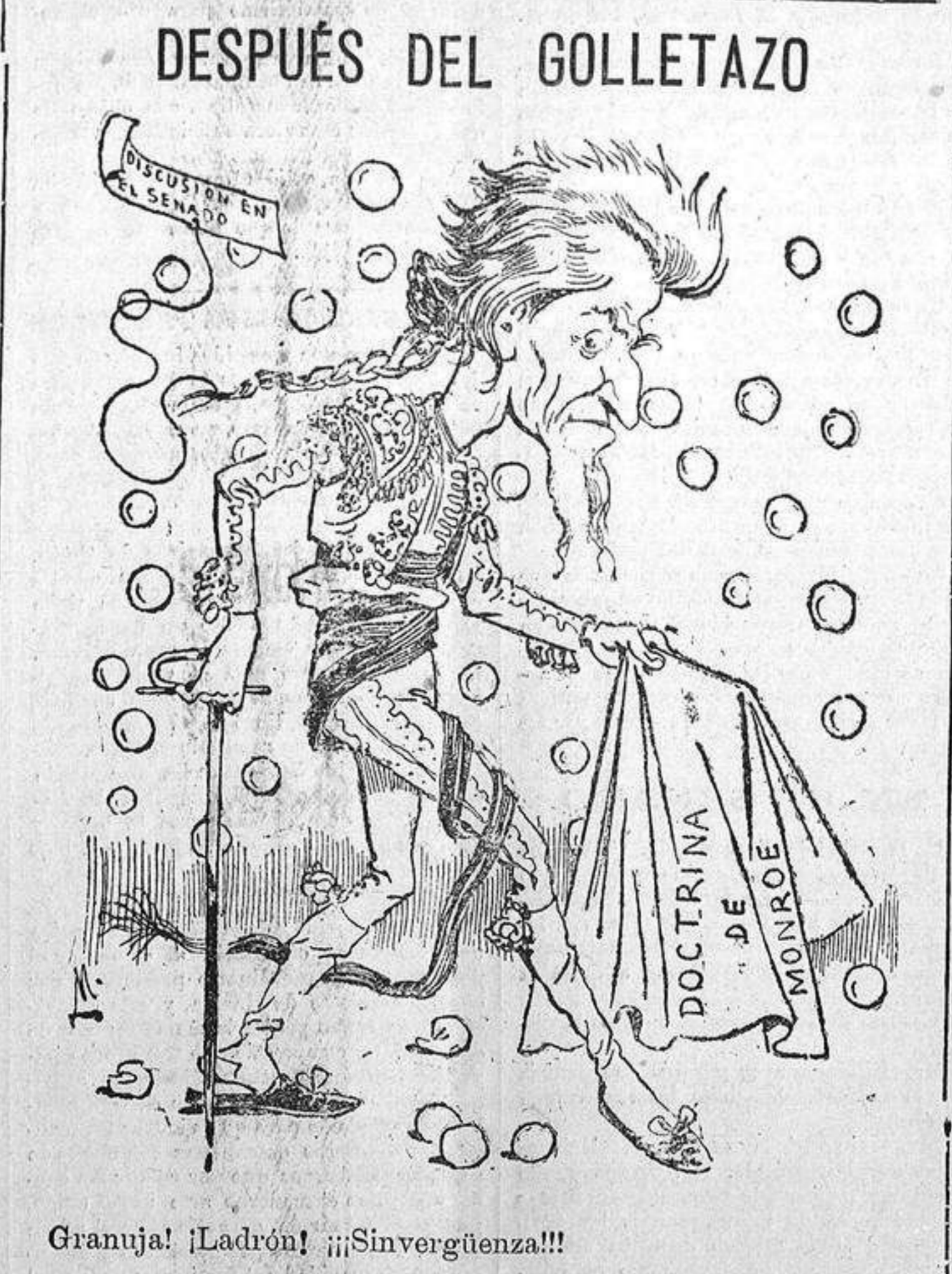
Granuja! ¡Ladrón! ¡¡¡Sinvergüenza!!!

En la mesa y en el juego se conocen las personas decentes.