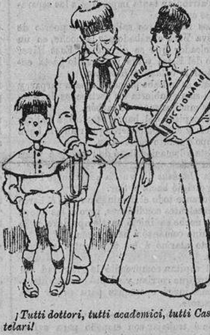
¡Tutti dottori, tutti academi, tutti Cas- telari!

He aquí una fotografía hecha expresa- mente para LA CORRESPONDENCIA DE ES- PAÑA de una de las primeras escenas de La mujer de Loth .