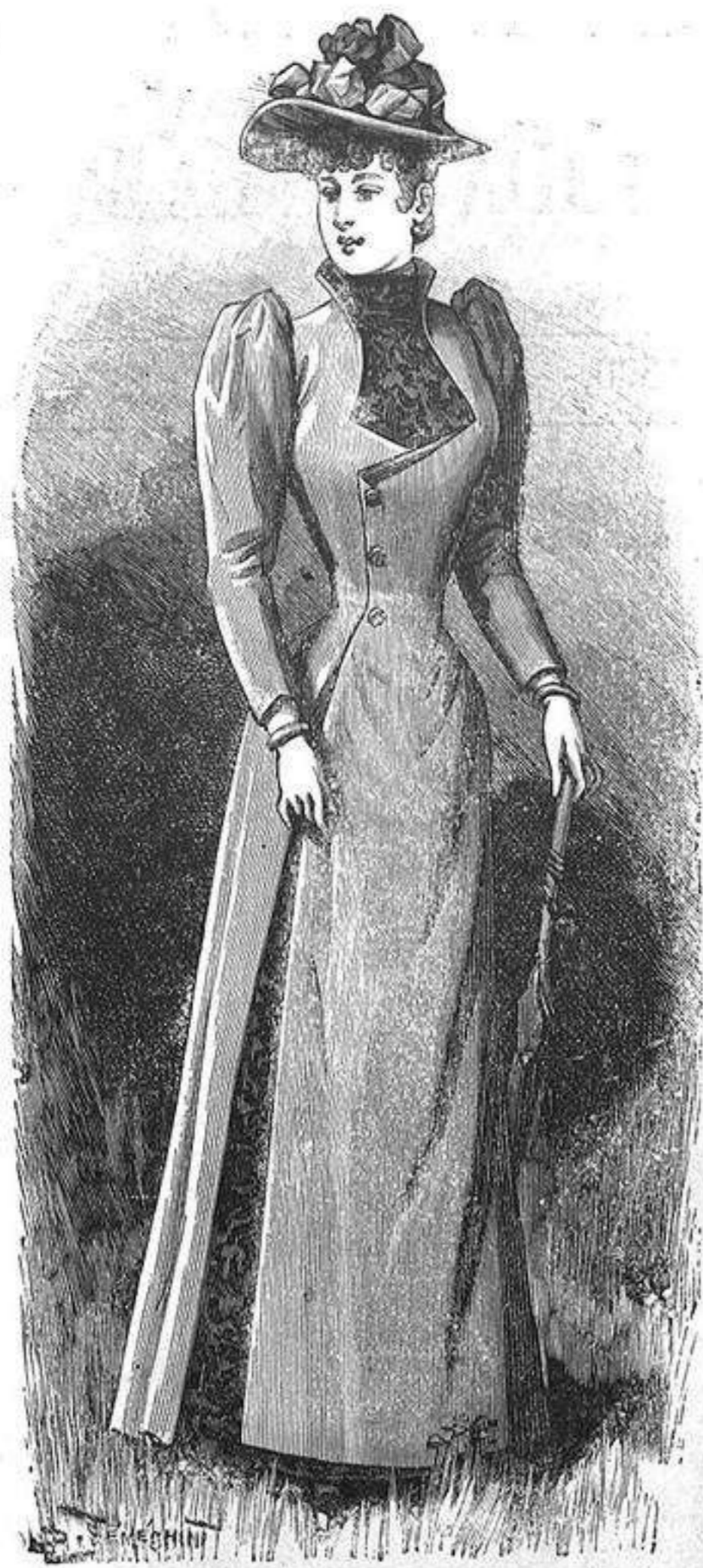
NUM. 4.—Trac de pascó.

Pocas novedades ofrece la hechura de los vestidos: la única de importancia que podemos consignar es la nueva tentativa