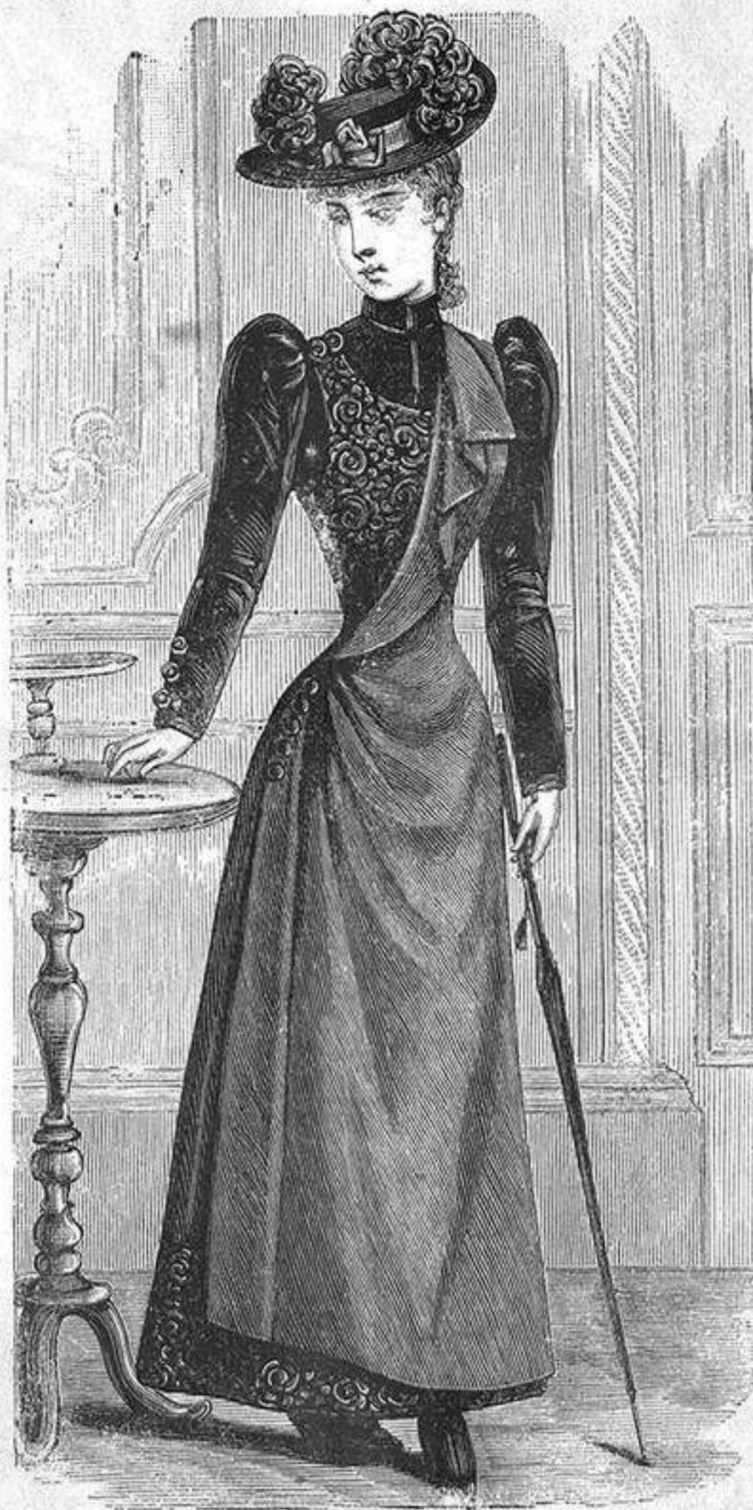
NUM. 11.—Traje para jovencita.