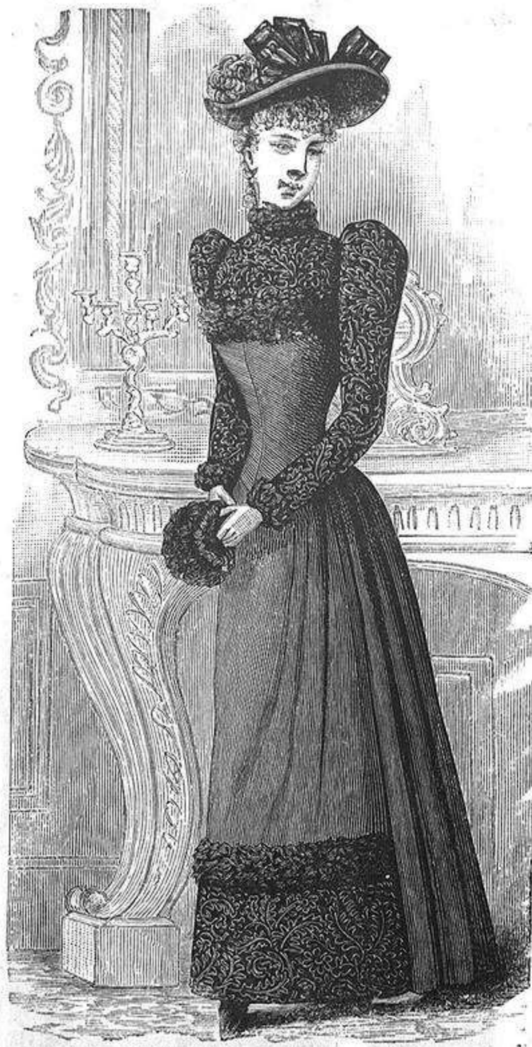
NUM. 9.—Traje para jovencita.