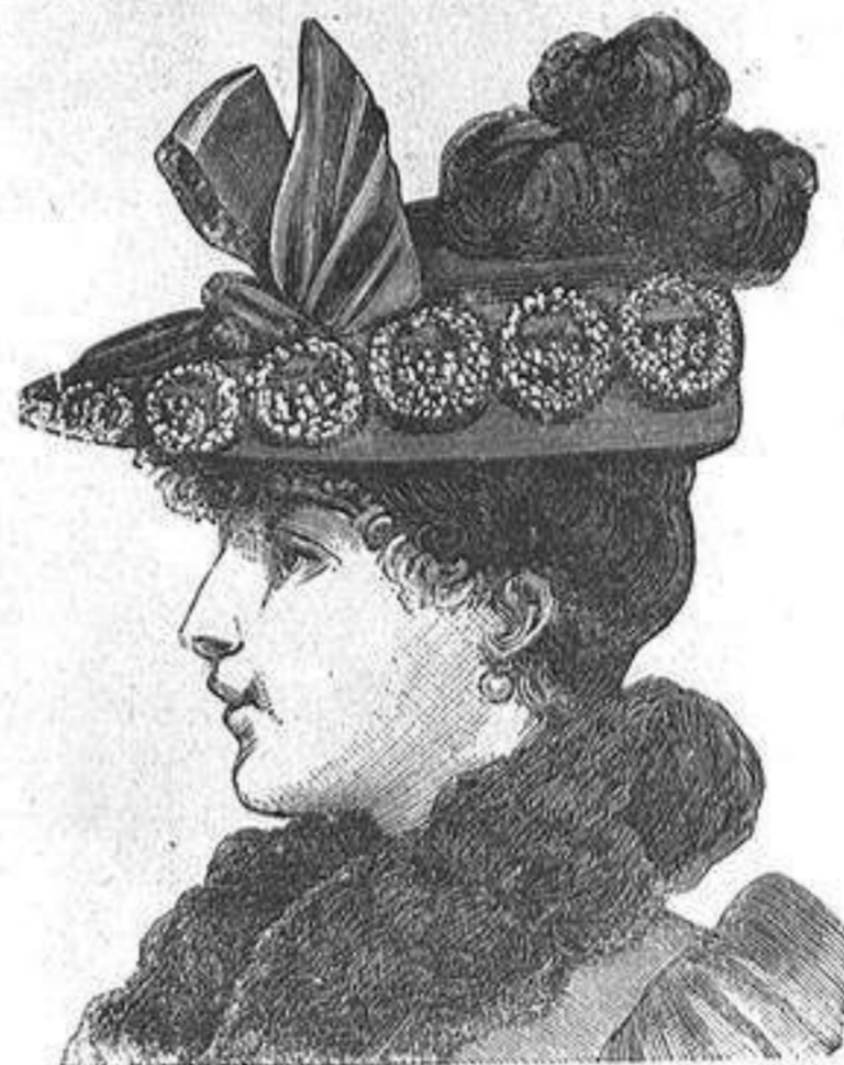
NUM. 7.—Sombbrero de fieltro.

de volver á los vestidos de cola, que en el buen sentido rechaza, especialmente para trajes de calle, tentativa que á no dudar no llegará á prevalecer. Entre tanto se hacen muy ceñidos por las caderas y con poco vuelo tambien por abajo. Como un modelo de elegancia, para trajes de visita, citaremos un vestido de bengalina color gris azulado adornado con galones color oro viejo con incrustaciones de nácar y fleco del mismo color; la falsa falda está adornada en el bajo con dos hileras de flequillo, y la falda verdadera recogida un poco sobre la ca-