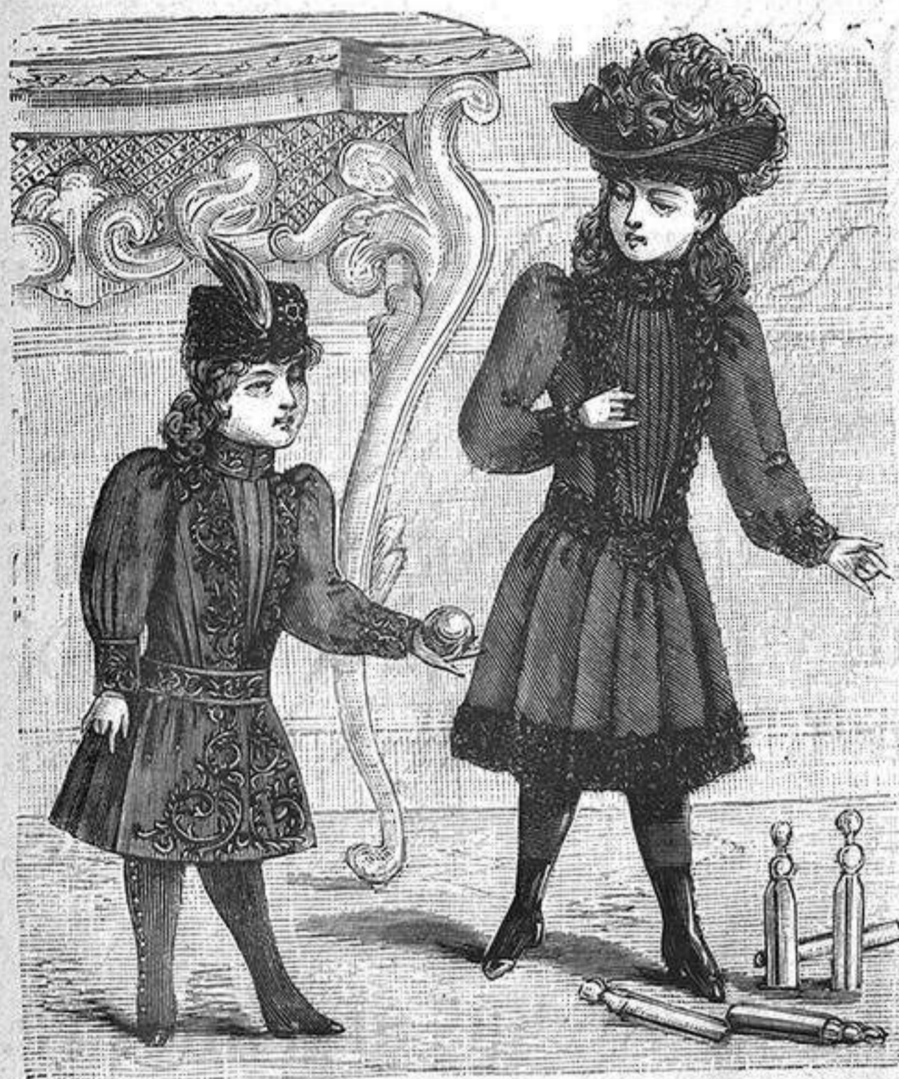
NUM. 5.—Dos trajes para niño.