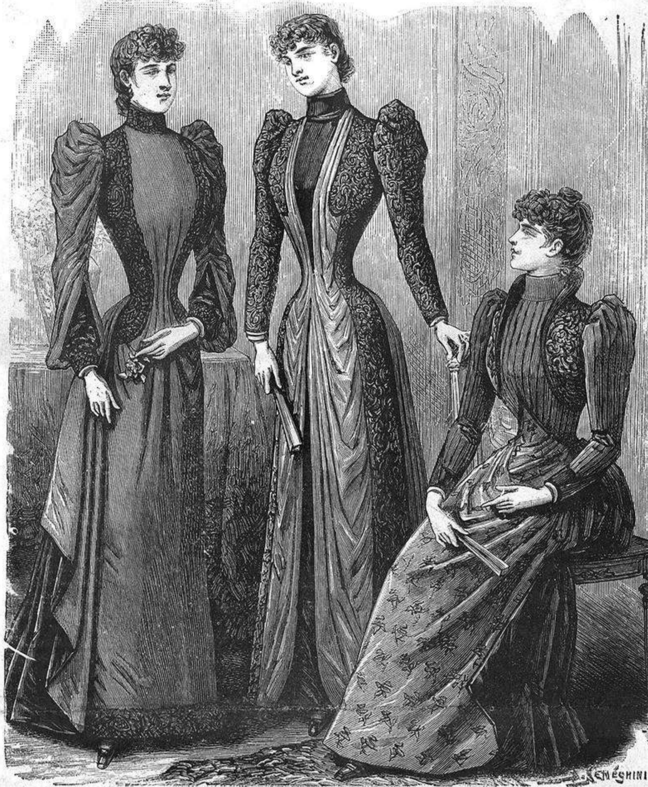
NUM. 1.—Tres trajes para señora.

Núm. 7.—Sombrero de fieltro gris con el ala alzada en cada lado hácia la copa y adornado con rico galon de acero y un drapeado de terciopelo gris, forma lazada por delante; en la parte posterior lleva