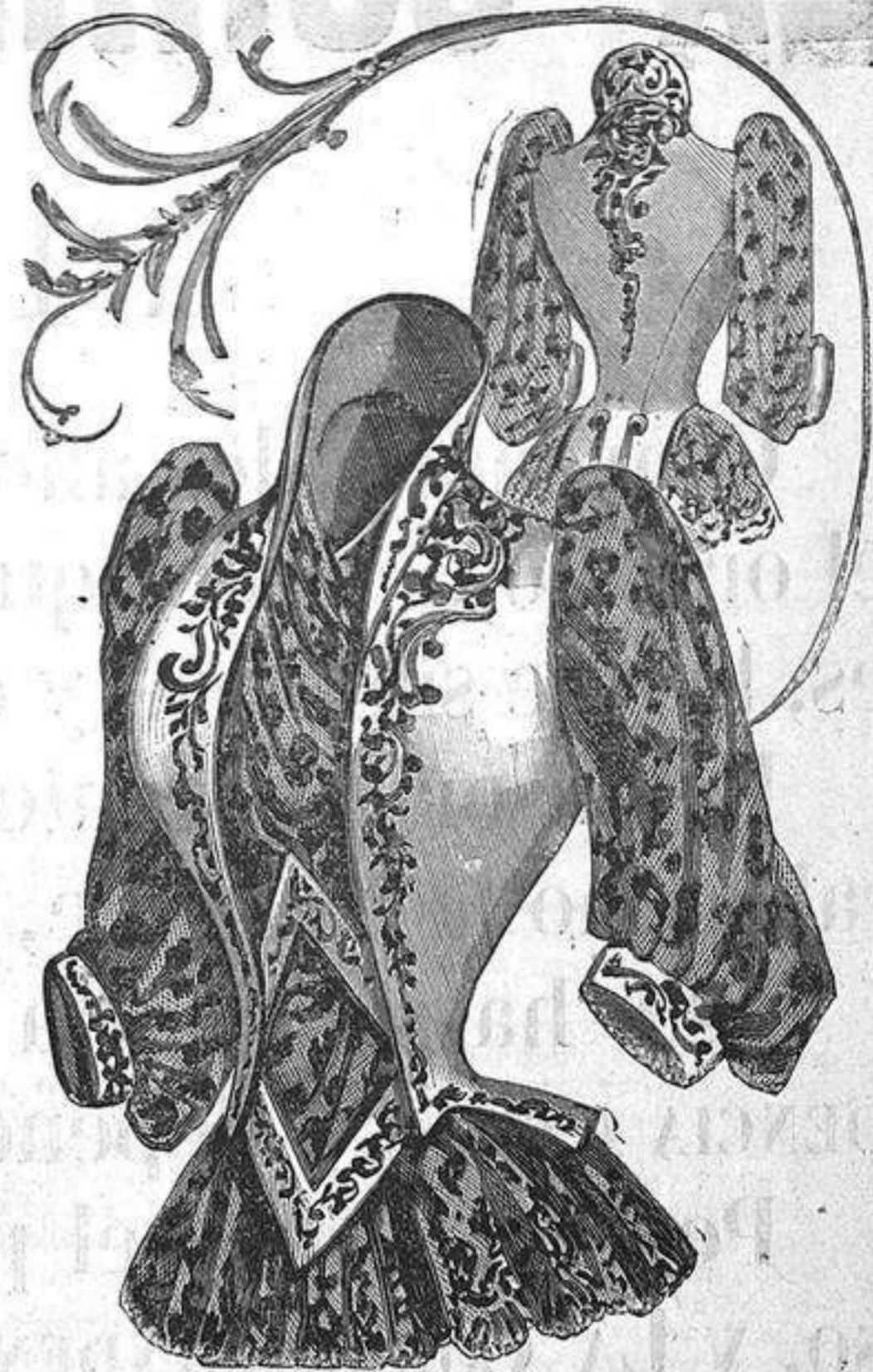
NUM. 3.—Cuerpo de raso duquesa.