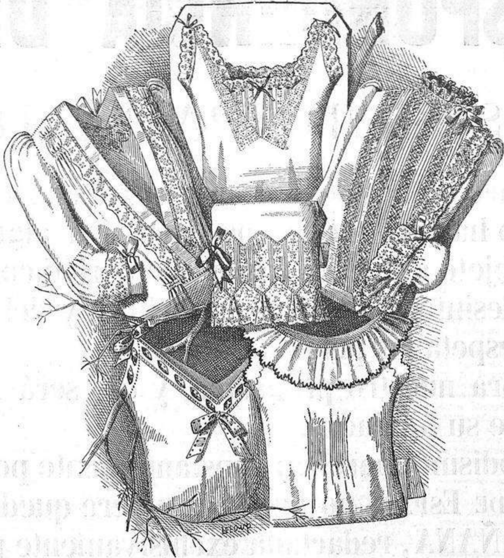
NUM. 11.—Ropa interior.