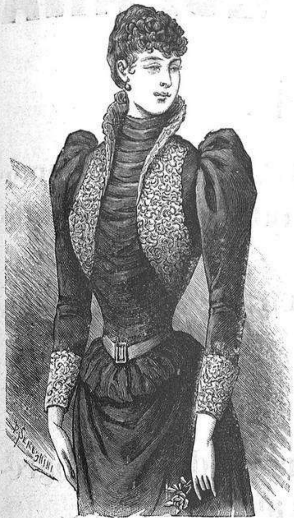
NUM. 2.—Traje de interior.