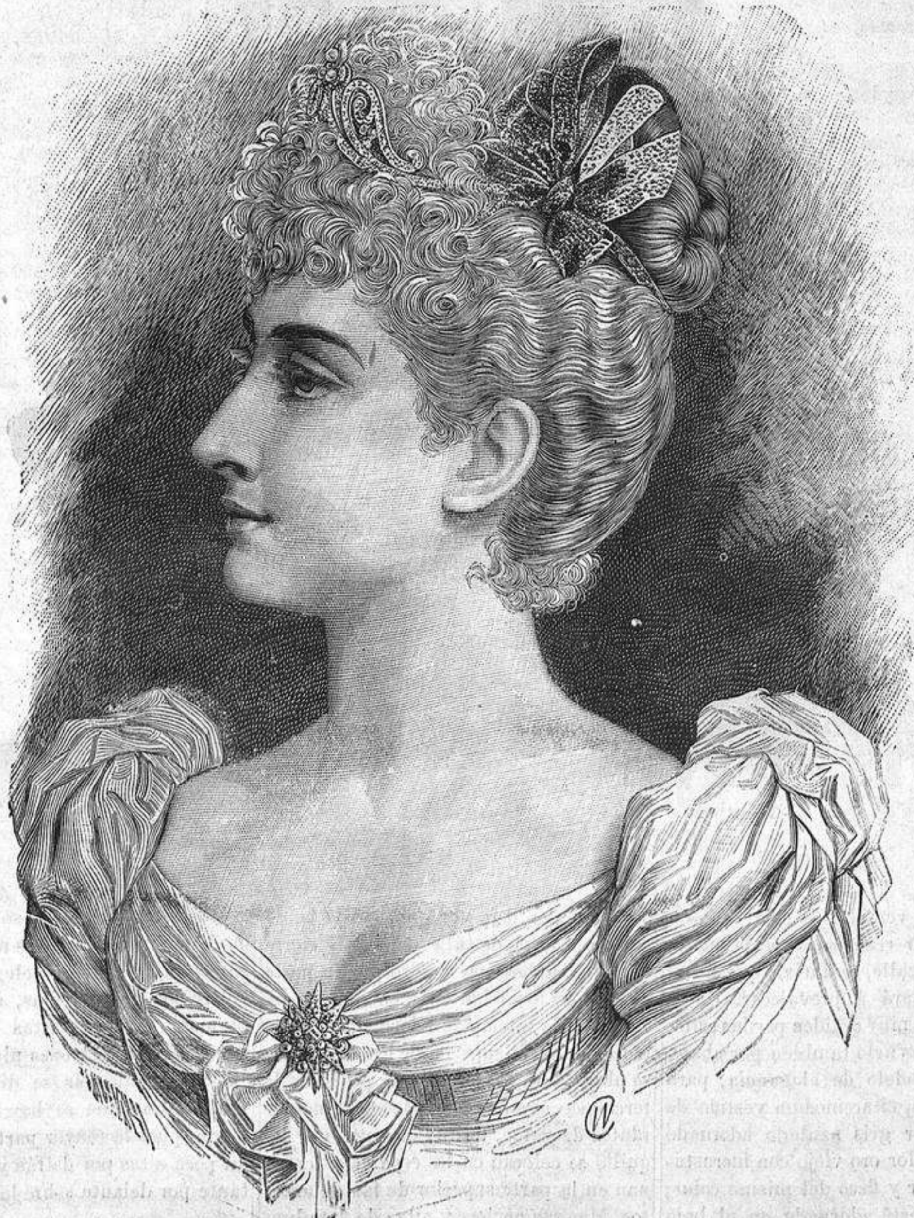
NUM. 10.—Peinado griego para baile.

un grupo formado por tres manojos de plumas rizadas.