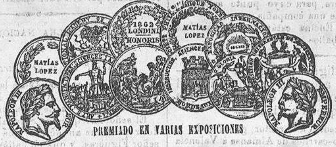
PREMIADO EN VARIAS EXPOSICIONES

Se aseguran buques y mercancías para cualquier punto, con condiciones sumamente aceptables para el asegurado. Representantes en esta plaza, Faes Hermanos.