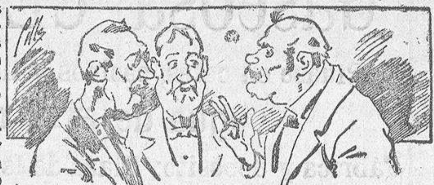
Abominan á nuestros libros..... pero los compran.