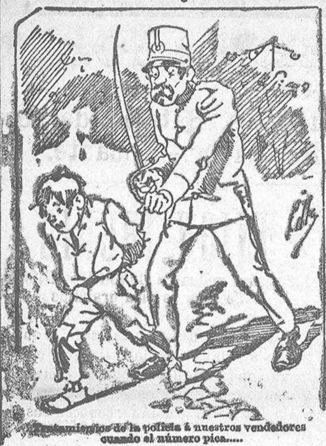
Los señores de la policía á nuestros vendedores cuando el número pica....

También puede pedirse LA AVISPA y el CATALOGO RESERVADO en casa de nuestros corresponsales autorizados, si no se quiere escribir á la Administración.