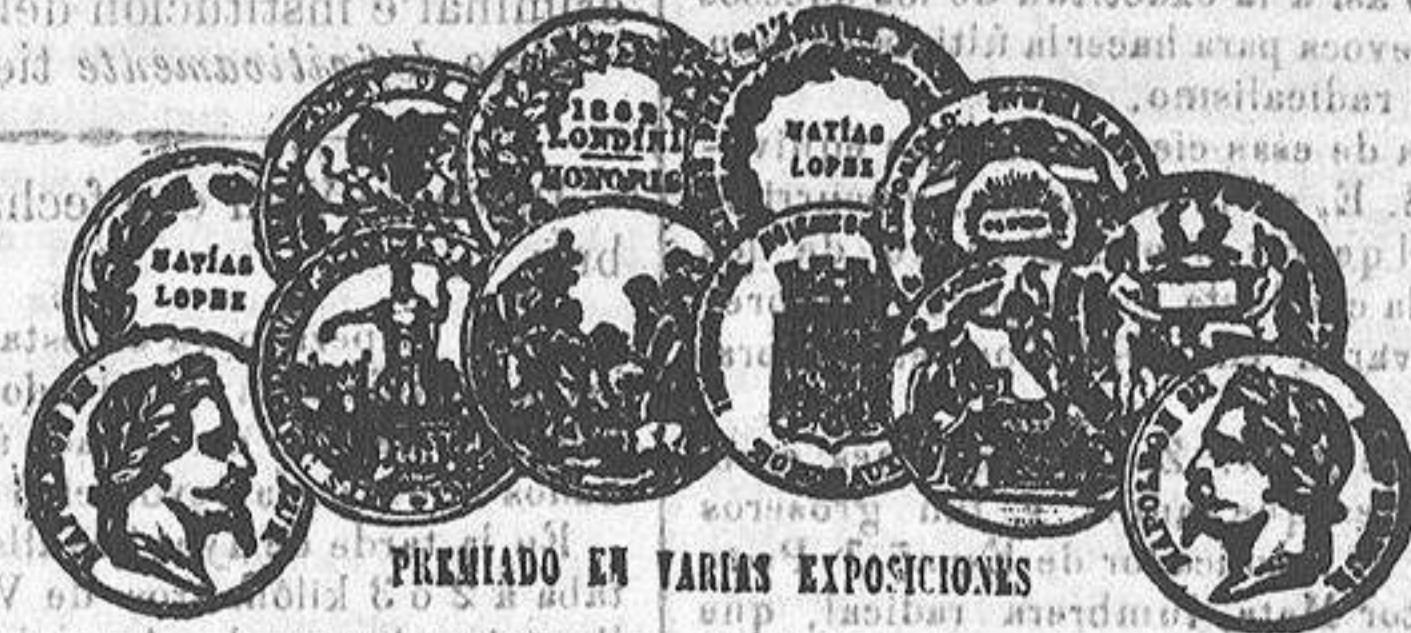
PREMIADO EN VARIAS EXPOSICIONES

1.ª PILDORAS NUTRIMENTIVAS DE PEPSINA ACIDIFICADA, para curar las afecciones gastralgicas dispepticas etc., y para todas las ocasiones en que la digestion sea difícil o imposible. 2.ª PILDORAS DE PEPSINA UNIDA AL HIERRO, REDUCIDO POR EL HIDROGENO, para curar las enfermedades cloróticas y todas las afecciones que de ellas dependen (pérdidas blancas, colores pálidos, menstruacion difícil) y tambien para fortalecer los temperamentos debilitados. 3.ª PILDORAS DE PEPSINA UNIDA AL PROTO-YODURO FERROSO INALTERABLE, para curar las enfermedades escrofulosas, linfaticas, la tisis, la caquexia clorótica y las afecciones atónicas generales de la economía. Estas tres preparaciones se venden exclusivamente en frascos y medios-frascos triangulares, con la garantía del sello y de la firma de Th.—Paul Hogg, farmacéutico químico, rue Cassington, 36 París; y en todas las buenas farmacias de Francia y de Europa. El precio en París, está indicado sobre cada frasco. Depositarios: En Madrid, Sres. Bellido y Lorenzo R. Hernandez.