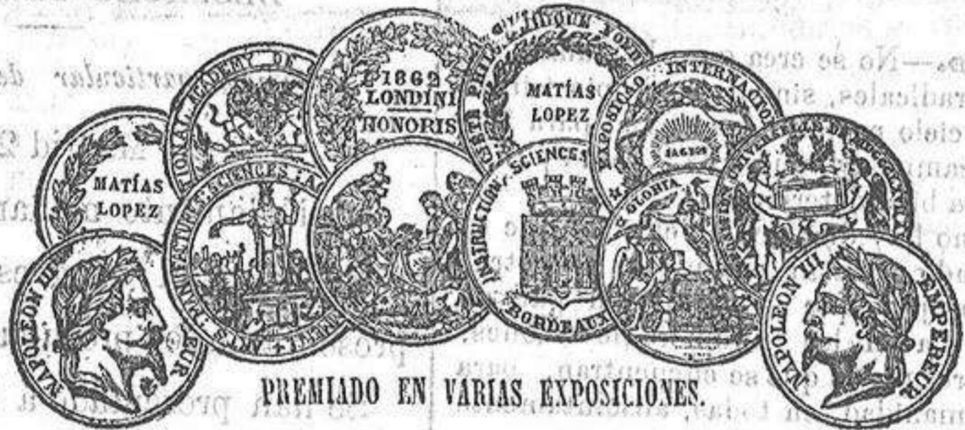
PREMIADO EN VARIAS EXPOSICIONES.