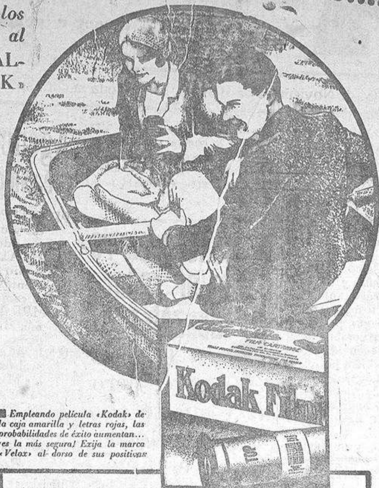
Empleando película «Kodak» de la caja amarilla y letras rojas, las probabilidades de éxito aumentan... ¡es la más segura! Exija la marca «Velox» al dorso de sus posiciones.

No hace falta usar aparatos costosos ni complicados; puede usted servirse del más sencillo «Brownie» o «Kodak» cuyo fácil manejo aprenderá en sólo unos minutos.