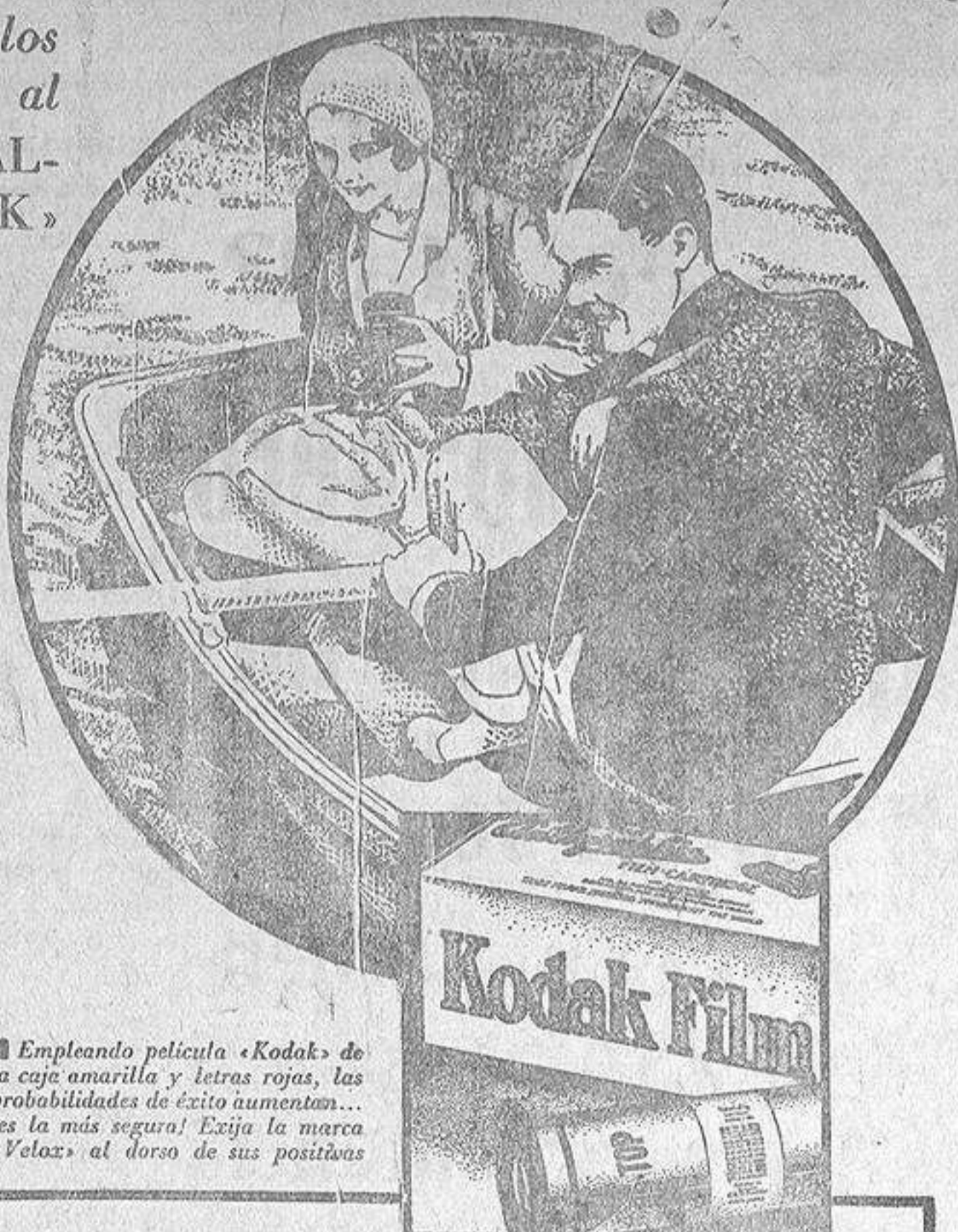
Empleando película «Kodak» de la caja amarilla y letras rojas, las probabilidades de éxito aumentan... ¡es la más segura! Exija la marca «Yellow» al dorso de sus positivos

No hace falta usar aparatos costosos ni complicados; puede usted servirse del más sencillo «Brownie» o «Kodak» cuyo fácil manejo aprenderá en sólo unos minutos